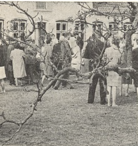
et par af de sønderjyske slægtsgårde. Billedet er ægtled har været i samme slægts eje.

kr. mod budgetteret 51.550 kr. og slutter med et overskud på 4.000 kr. mod budgetteret 500 kr.