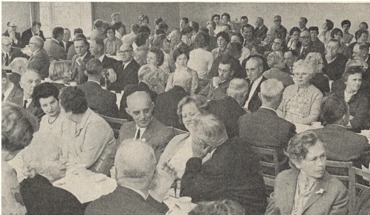
Årsmødet på restaurant Skamlingsbanken var et af Dansk Slægtsgaardsforenings største. – Det havde samlet 337