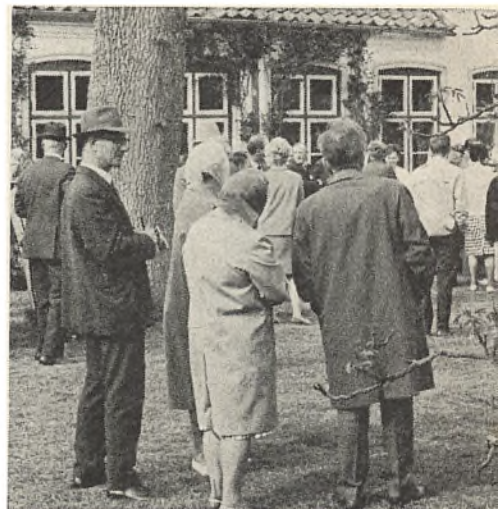
Arsmødearrangementet omfattede også besøg på fra besøget på Sillerupgård, der i 10.