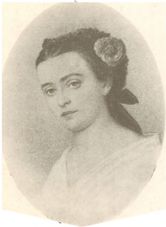
FRITZE LOUISE VON JESSEN, F. LETII (1834–1916)

Efter Akvarel, malet 1860 af Edv. Lehmann. (Originalen: 20 × 16 cm.)