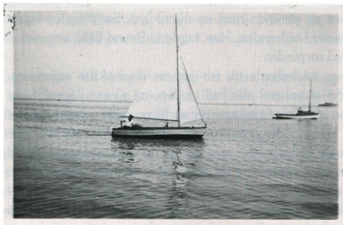
»Ternen«, den båd far byggede i baggården.

for bådpladsen, men pludselig tog han en alt for hurtig vending og kuldsejlede. Far var hurtig og satte sig på lønningen, medens en af sejlervennerne startede sin båd og hentede »Ternen« og far ind.