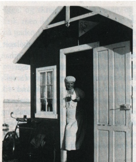
Mor i døren til klubhuset.

Enkelte søndage sejlede familien en tur med »Indianeren«, og det hændte, far lagde til ved B&W's badebro, som lå lige bag det store marketenteri. Her gik far og mor i vandet. Der var så dybt, at Svend