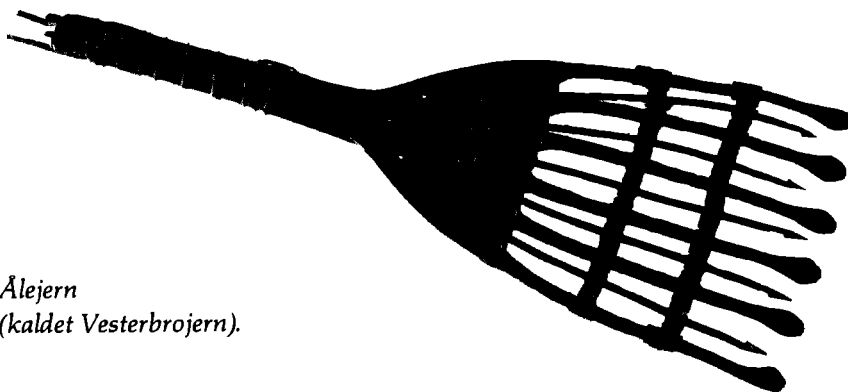
Ålejern (kaldet Vesterbrojern).