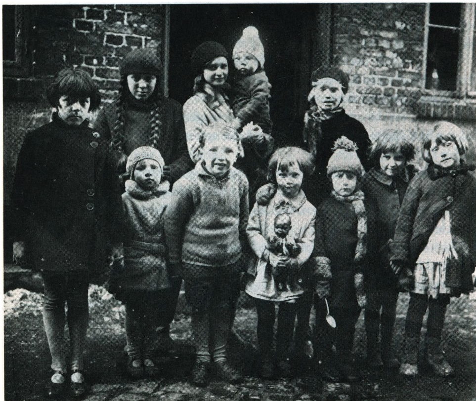
Prinsessegade 65 over gården, dec. 1930.

Prinsessegade 65 over gården var bagbygningen som var på 5 etager. På hver etage var der to to-værelses lejligheder på ca. 30 m 2 og seks