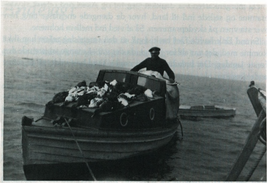
Far i »Indianeren« på vej hjem fra jagt på Saltholm, med skydeprammen på slæb.