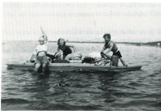
Skydeprammen med bagagen til ferien på Saltholm, 1937.