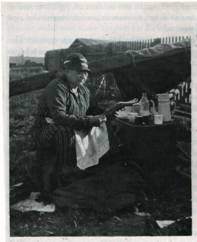
Bedste på bådpladsen. 1931.

tørre, når man skulle have dem på, men det var der ikke noget at gøre ved!