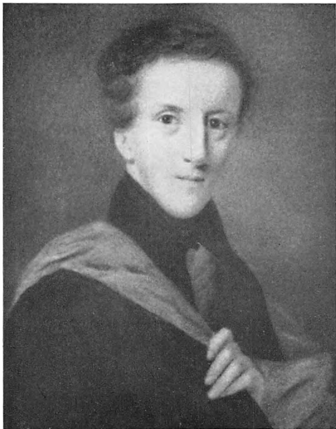
L. F. Møller: Ungdomsportræt af Frederik VII (Jægerspris).