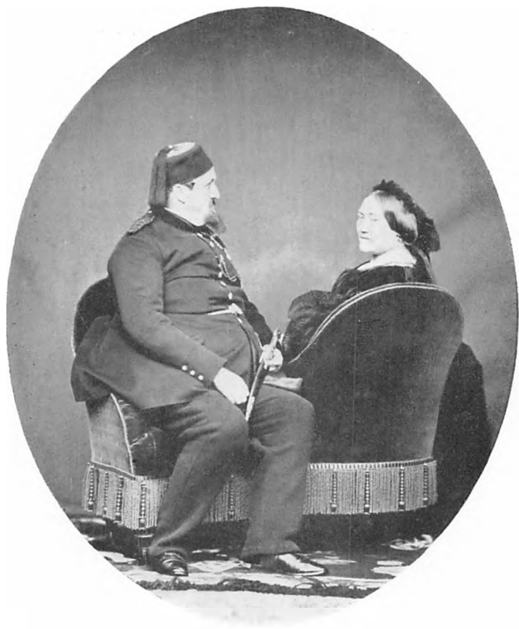
Frederik VII og Grevinde Danner i Samtale paa en »Confidencé». (Efter Fotografi. Jægerspris).