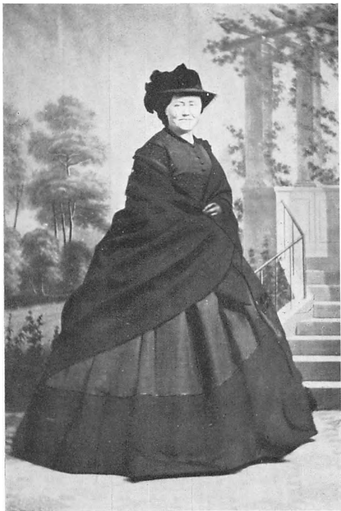
Grevinde Danner som Enke. (Efter Fotografi ca. 1870).