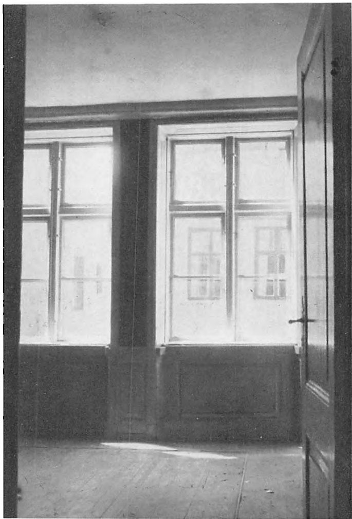
Louise Rasmussens Storstue i Borgergade 36 l . Nedrevet i 1942. (Efter Fotografi).