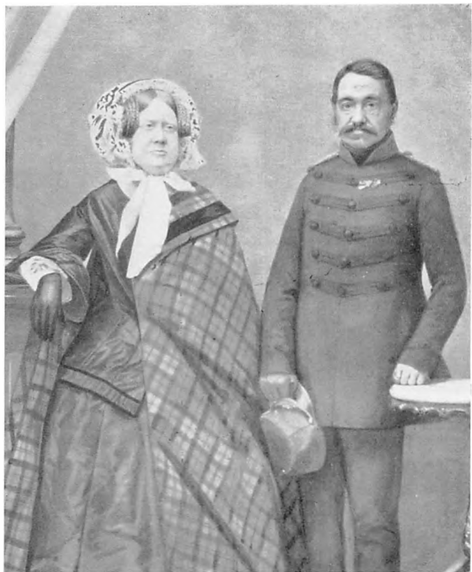
Grevindens Bordkavaler, Arveprins Ferdinand med Arveprinsesse Caroline. (Efter Fotografi) 1861.