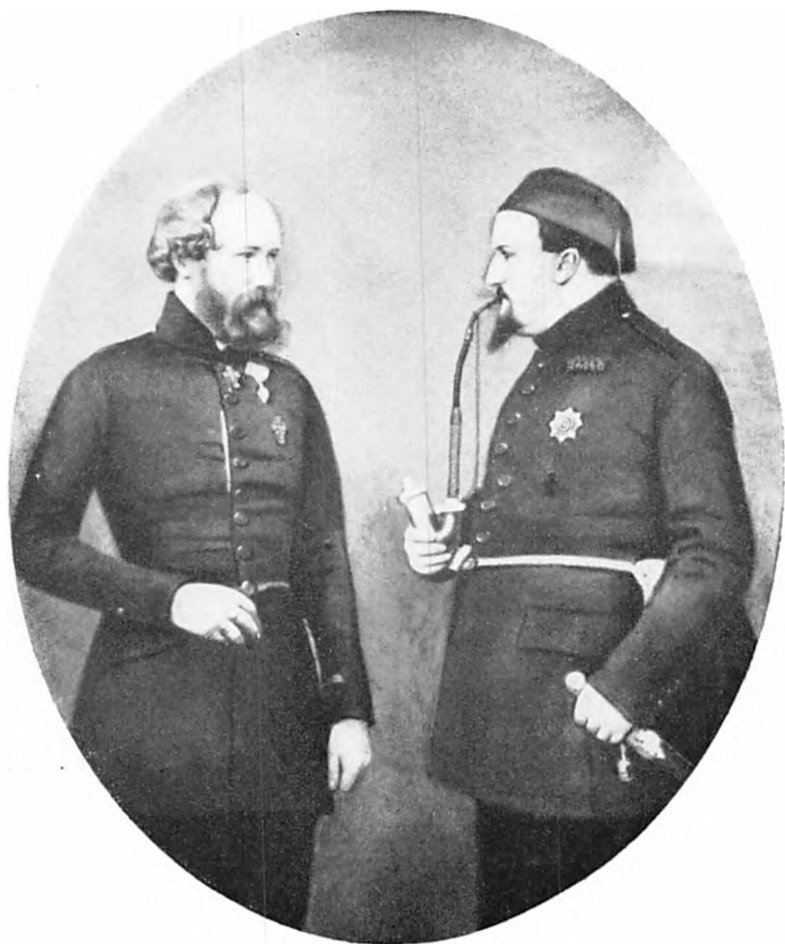
Frederik VII i Samtale med Carl Berling. (Efter Fotografi. Jagerspris).