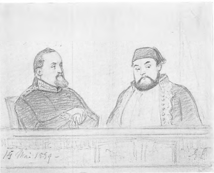
Kong Frederik VII og Prins Mehemmed Ali af Ægypten i Teatrets Kongeloge 1859. Efter Tegning af Edv. Lehmann.