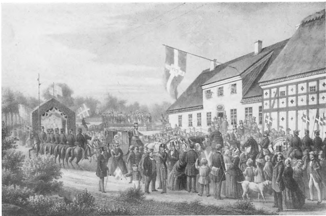
Typisk Billede fra Rejserne: Kongen taler fra sin Vogn til Mængden ved Gribsvad Kro. 1861. Grevinden har taget Plads i den efterfølgende Vogn. (Efter Tegning og Litografi af N. F. Niss. Teatermuseet).