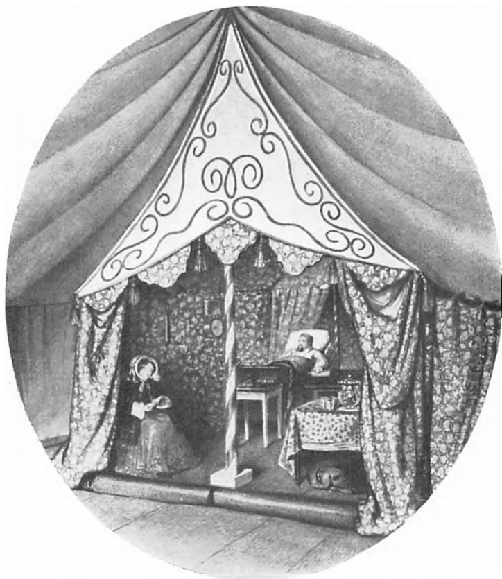
Grevinde Danner læser for Kongen i Teltet ved Skoldsborg. Draperierne blev efter hans Død brugt til Møbelbetræk. Efter farve- lagt Tegning af E. Young. 1853. (Jægerspris).