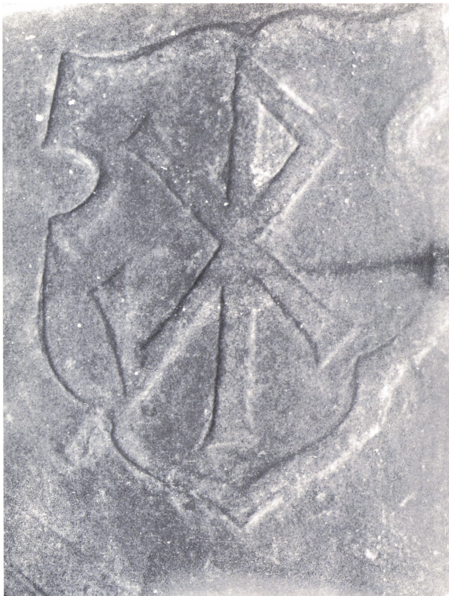
Maren Knudsdatters bomærkeskjold på gravstenen i Skamby.