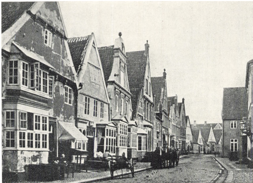
Hovedgaden i Tønder i min Seminarietid