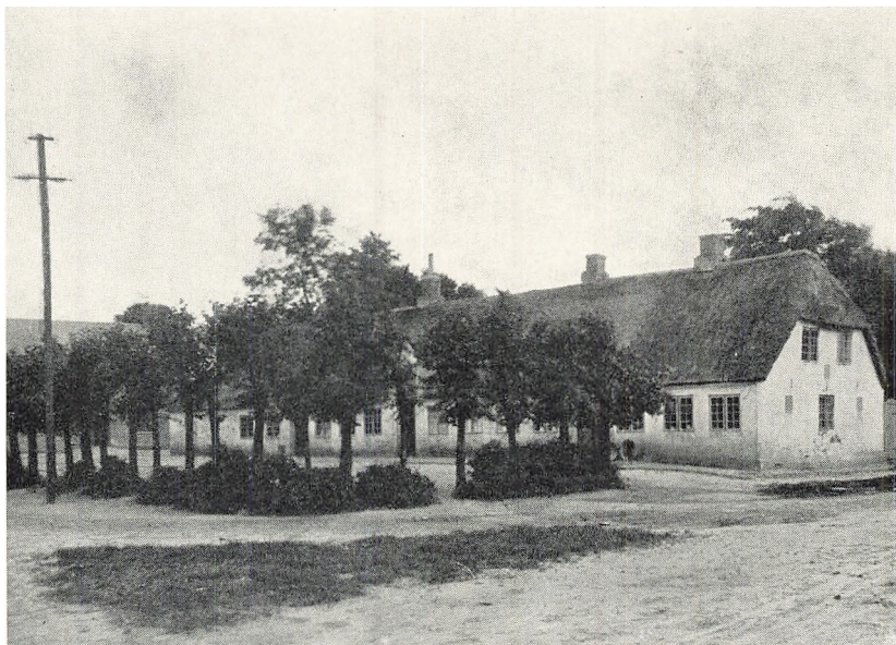
Den gamle Skole i Skærbæk, hvor jeg fik min første Undervisning