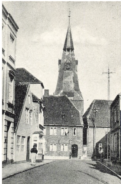
Bagved de to Vinduer foroven i det gamle nu ned- revne Hus laa mit Værelse som Seminarist i 1891-94