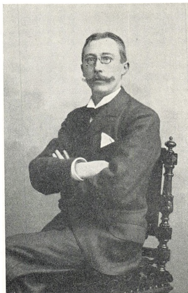
Redaktør af »Hejmdale« 1899-1904