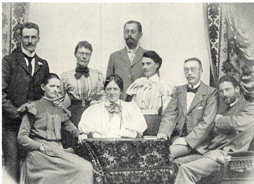
Paa Statens Lærerkursus 1898-99