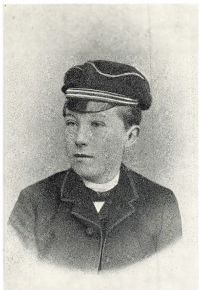
Præparand i Aabenraa 1889-91