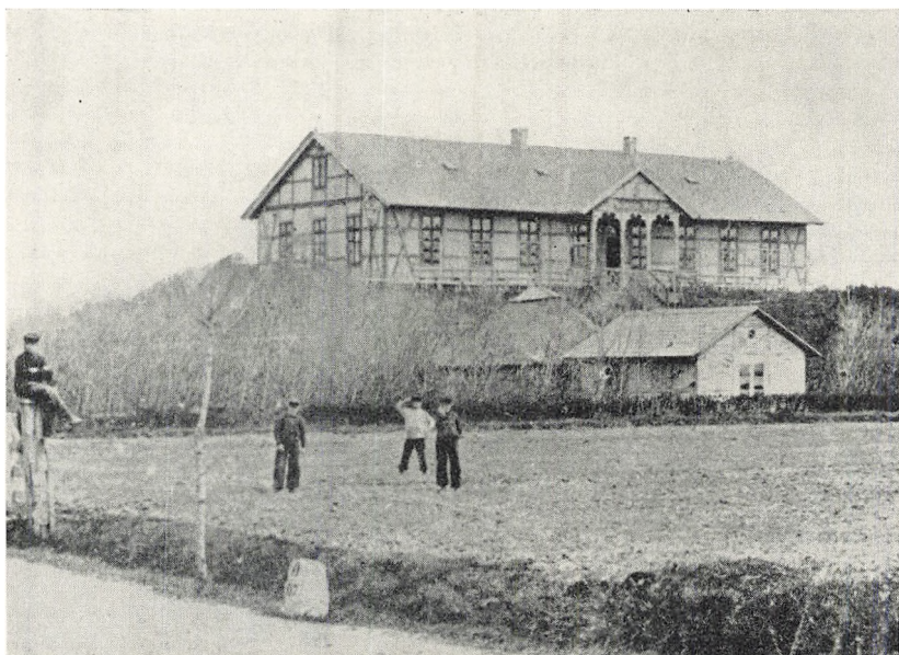
Svejtserhallen, hvor Seminaristerne færdedes og holdt Møder