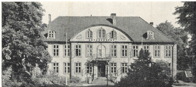
Billede af Amtsretsbygningen i Byen Slesvig. Bagved ligger Fængslet, hvor Forfatteren hensad i 3 Maaneder ved Begyndelsen af 1901