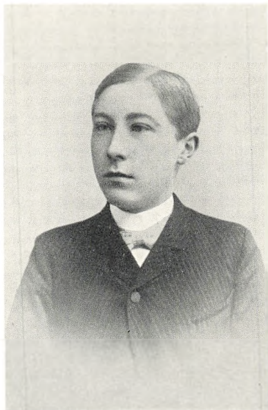
Seminarist i Tønder 1891-94