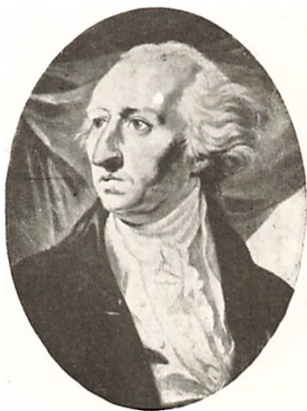
CARL AUGUST STRUENSEE v CARLSBACH