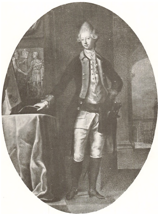
DRONNING CAROLINE MATHILDE I DRONNINGENS LIVREGIMENTS UNIFORM