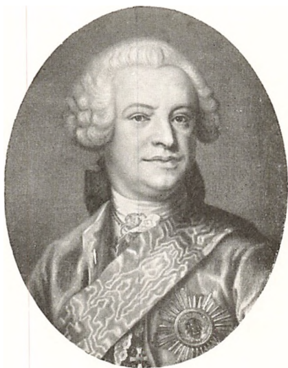
GREVE JOHAN HARTVIG ERNST BERNSTORFF