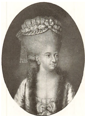
DRONNING JULIANE MARIE