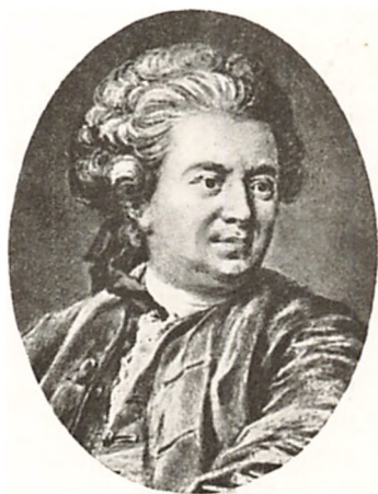
CARL GUSTAV PILO