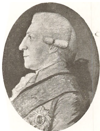
GREVE ADOLPH SIGFRIED von der OSTEN