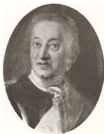
GREVE FREDERIK DANNEKJOLD-SAMSØE