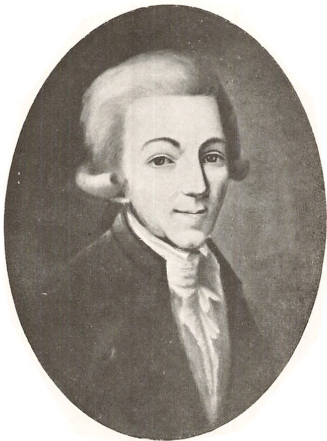
ELIE SALOMON FRANÇOIS REVERDIL