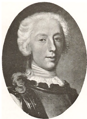
GLAUDE LOUIS DE SAINT-GERMAIN