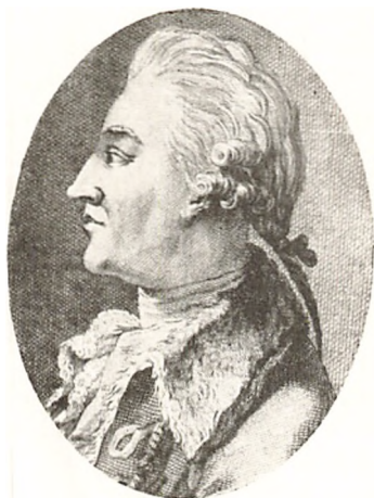
GREVE ENEVOLD BRANDT