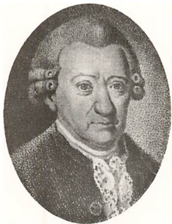
GEORG CHRISTIAN OEDER