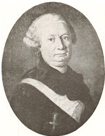
GREV DITLEV REVENTLOU