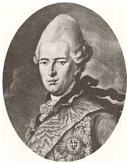
PRINS CARL. AF HESSEN