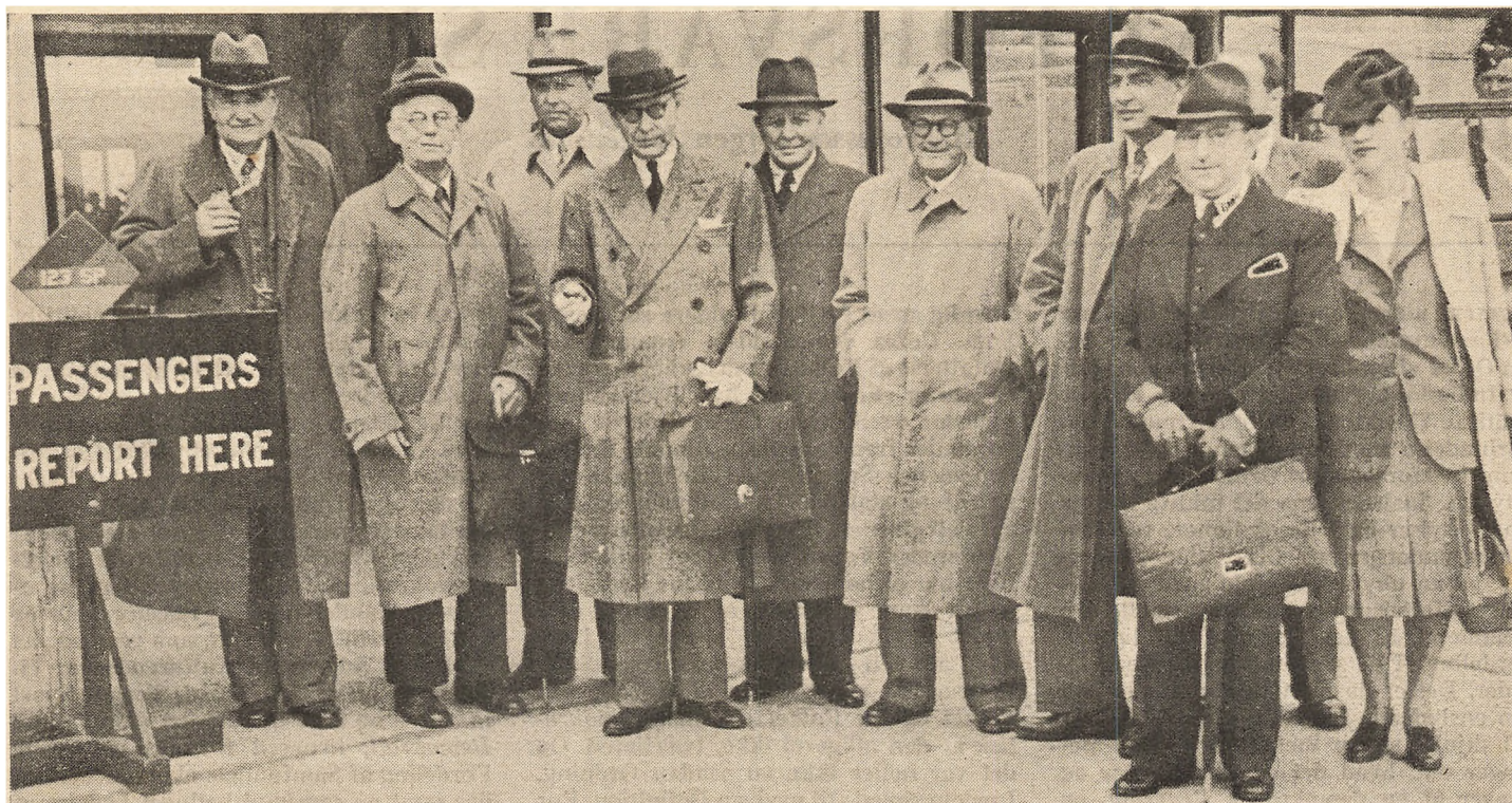
Delegationsmedlemmer paa Vej til Forhandlingerne i London.

Mon det er Reminiscenser fra Vikingetogene, der bevirker at det officielle Danmark altid skal optræde i store Flokke i England? Sammensætningen af den Delegation, der nu er hjemme for at aflægge Rapport, kunde tyde paa det, selvom Antallet er nedskaaret i Sammenligning med Delegationerne fra før Krigen. Men det skal jo være sløjt med Hotelplads i London.