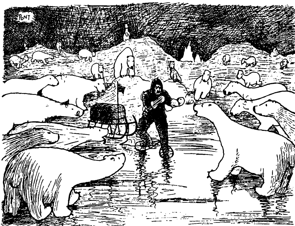
Refusal to admit defeat (Vægning ved at erkende Nederlaget) — en karakteristisk Tegning af Pont fra »Punch».

Man kan tale med en Englænder i timevis, før han lader skinne igennem, at han er Ekspert paa det Emne, man letsindig har bragt paa Bane, og det er karakteristisk, at mens Skandinaver og Tyskere elsker at demonstrere, at de er flittige og har travlt, ynder Englændere at opretholde en Fiktion om, at de egentlig ikke bestiller noget, til Desorientering for lettroende Udlændinge.