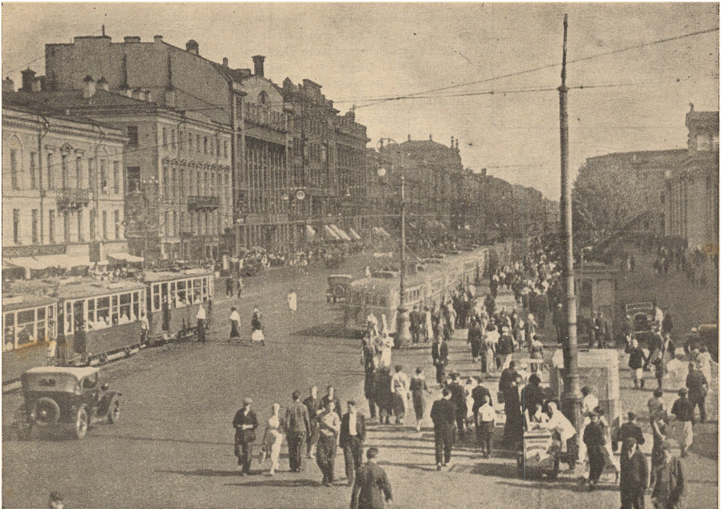
Havde De troet, der ser saaledes ud i Leningrad?