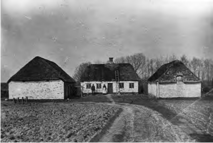
4H gården anno 1906