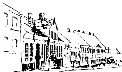
Det gamle apotek i Tranekær

Efter en rundvisning på arkivet, der har til huse i den gamle stationsbygning på Hav-