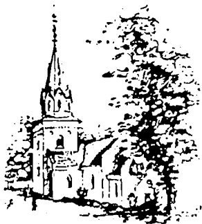
Tranekær kirke hvor min farfar og farmor blev viet

Emmerbøllegård, når de skulle ud at køre, og det har mine bedsteforældre sikkert også gjort, når de en enkelt gang skulle ud med hele familien. Fra Emmerbøllegård kørte man som regel også for naboerne efter læge eller jordemoder, når der var brug for det.