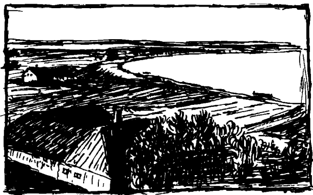
Thøger Larsen: pennetegning af barndomshjemmet og fjorden, ca. 1900

Men den, der sænker Sindet i Tallenenes Mystik fornemmer dunkelt Rytmen i Sfærernes Musik.