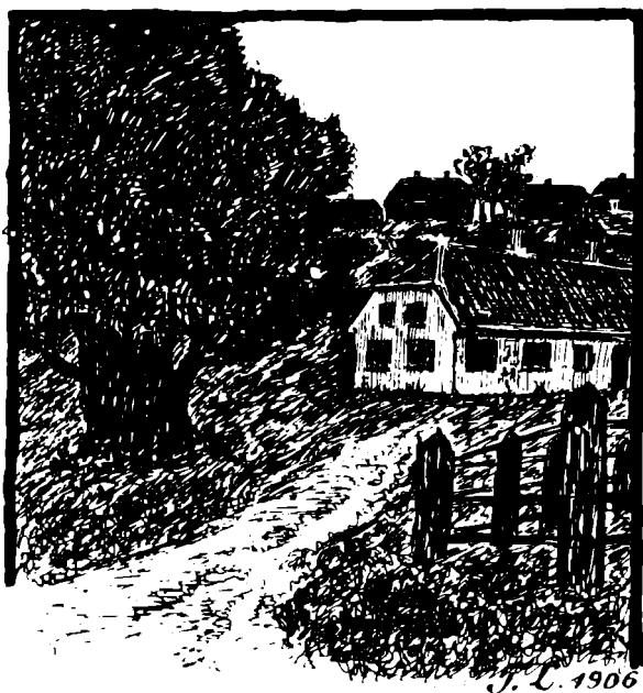
Tegning af Thøger Larsen. Anvendt i "Stjerner og Tid", 1914

Jeg vil haabe for det danske Aandsliv, at det i stigende Grad maa faa Opmærksomheden opladt for, at der er kulturelle Værdier, det ikke har Raad til at forsmaa, hvis det vil have Ret til at hævde sig som et Aandsliv.