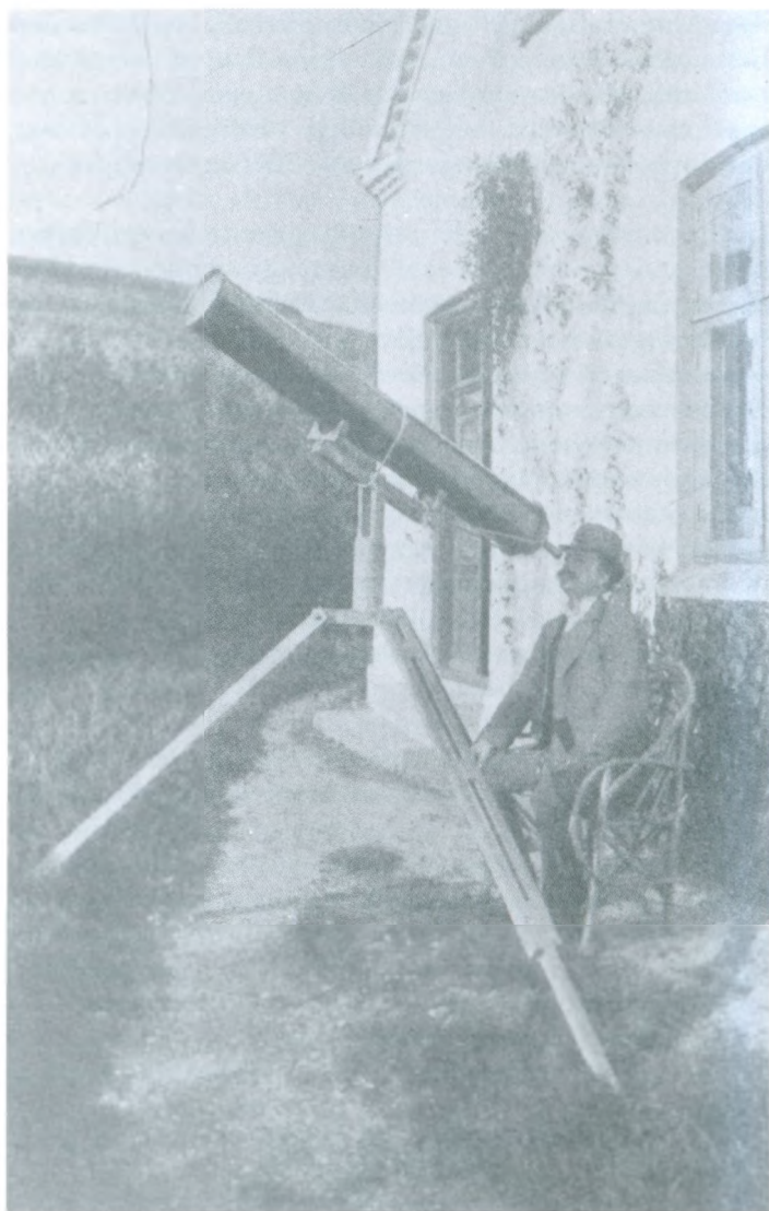
Thøger Larsen skuer ud i universet

Vignetter udført af Thøger Larsen