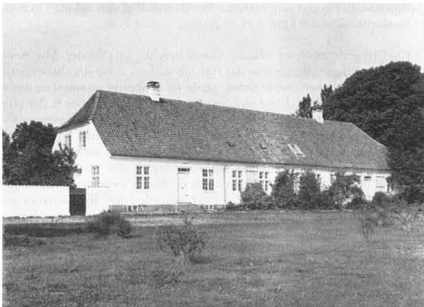
Vester Åbys præstegårds stuehus, fotograferet ca. 1970. Stald- og ladebygningerne i holstensk bindingsværk er nedrevet.

i stiftsmidlerne – afdrag og renter blev udredt af embedets tiendeindkomst. Disse finansieringsformer betød, at jo flere udgifter en præst havde på sin præstegård, jo større indhug blev der gjort i hans indkomst.