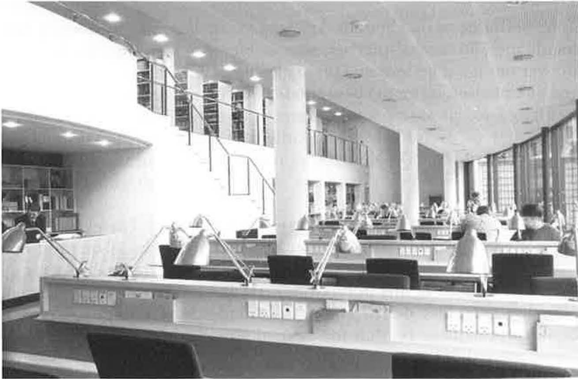
Øverst: Læsesal anno 1895. - Nederst: Læsesal anno 1995 (Foto: Birch og Krogboe).