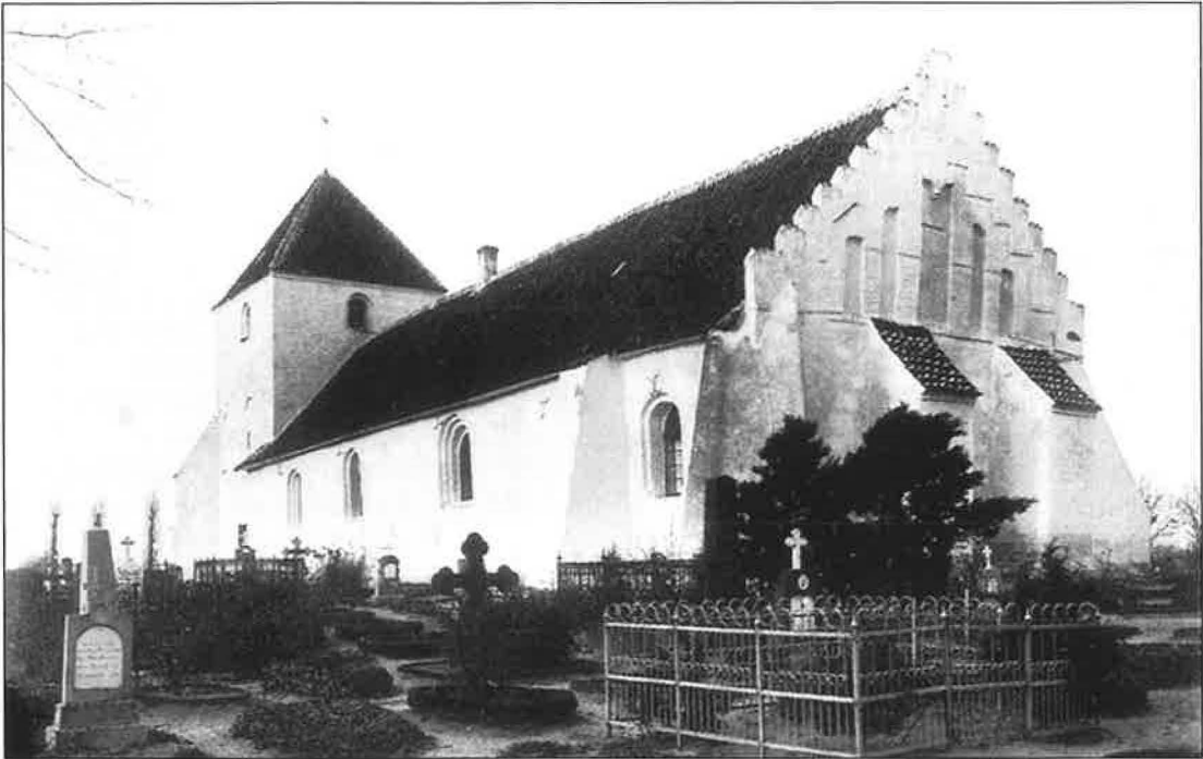
Bjerreby kirke ca. år 1900, nedrevet 1905.