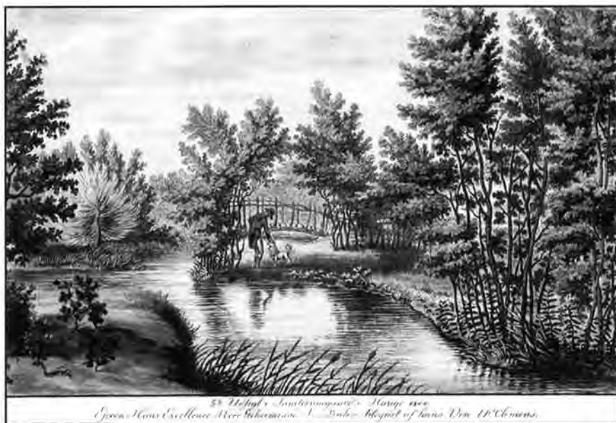
I.F. Clemens: 6te Udsigt i Sanderumgaard's Hauge 1800. Mål 10,5×16,6 cm. Formentlig Bülow med hund. Under alle omstændigheder midt i havens ro og fred.