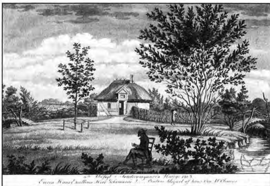
I.F. Clemens: 10de Udsigt i Sanderumgaard's Hauge 1803. Mål 10,3×16,5 cm. Dette lysthus er ikke navngivet men er et andet end det, som blev vist på forrige stik. Hvis billedet havde været vist i farve, ville man have kunnet se, at kreaturerne på marken til venstre alle er røde.