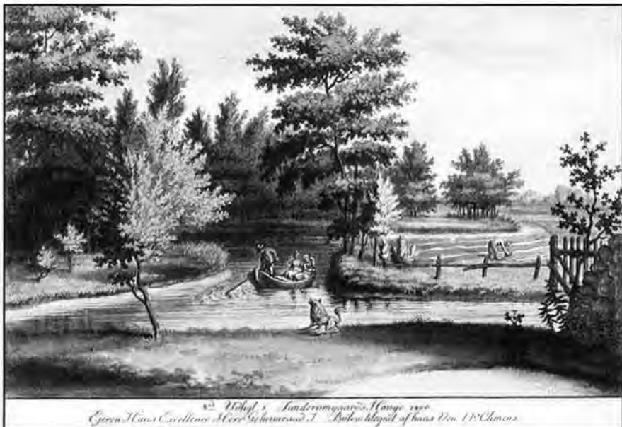
I.F. Clemens: 8de Udsigt i Sanderumgaard's Hauge 1800. Mål 10,5×16,6 cm. Forskellen mellem havens oplevelsespræg og markens pligtarbejde kommer tydeligt frem på dette stik.