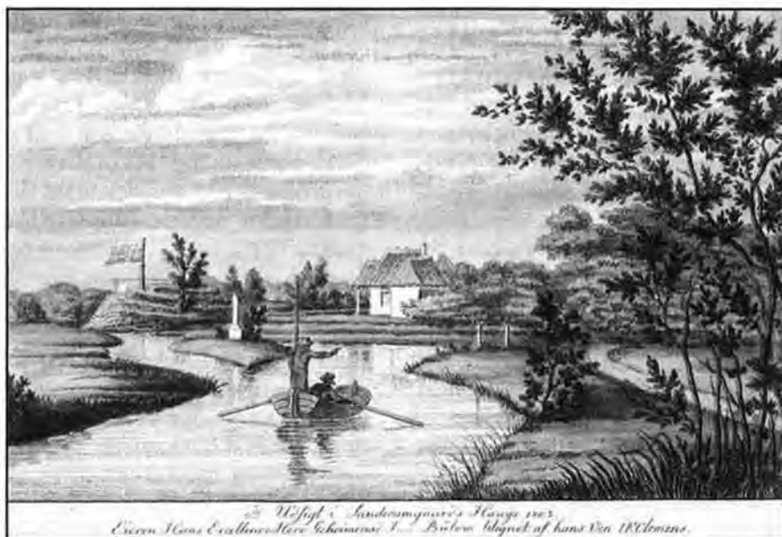
I.F. Clemens: 9de Udsigt i Sanderumgaard's Hauge 1803. Mål 10,3×16,5 cm. Havens snelegang er vist på oversigtskort, men sjældent fremstillet på billede. Bülow, der til stadighed udvidede haven, har formentlig anlagt den siden Clemens' forrige besøg i år 1800.