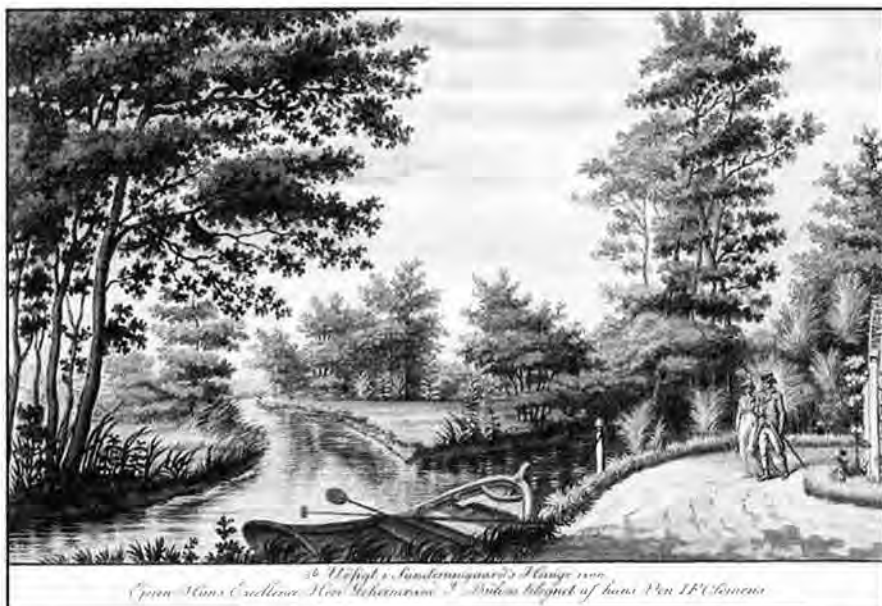
I.F. Clemens: 5te Udsigt i Sanderumgaard's Hauge 1800. Mål 10,5×16,6 cm. Dette og følgende tre stik er alle dateret 1800 og har let afvigende mål fra seriens øvrige.