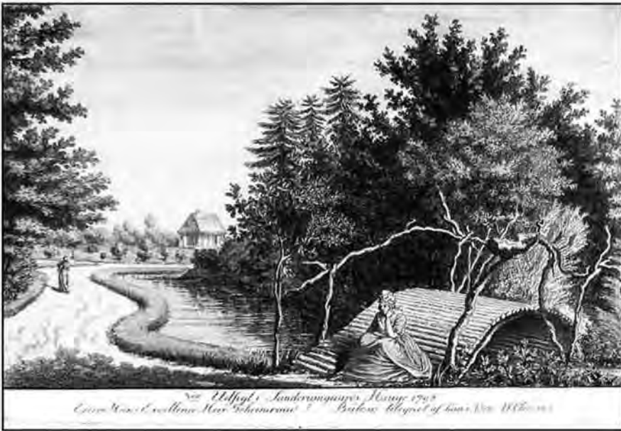
I.F. Clemens: 3de Udsigt i Sanderumgaard's Hauge 1798. Mål: 10,3×16,5 cm. Ved at anvende krogede grene som gelænder på broen vises respekt for naturens egne former i den ellers så regulerede og afstemte have.