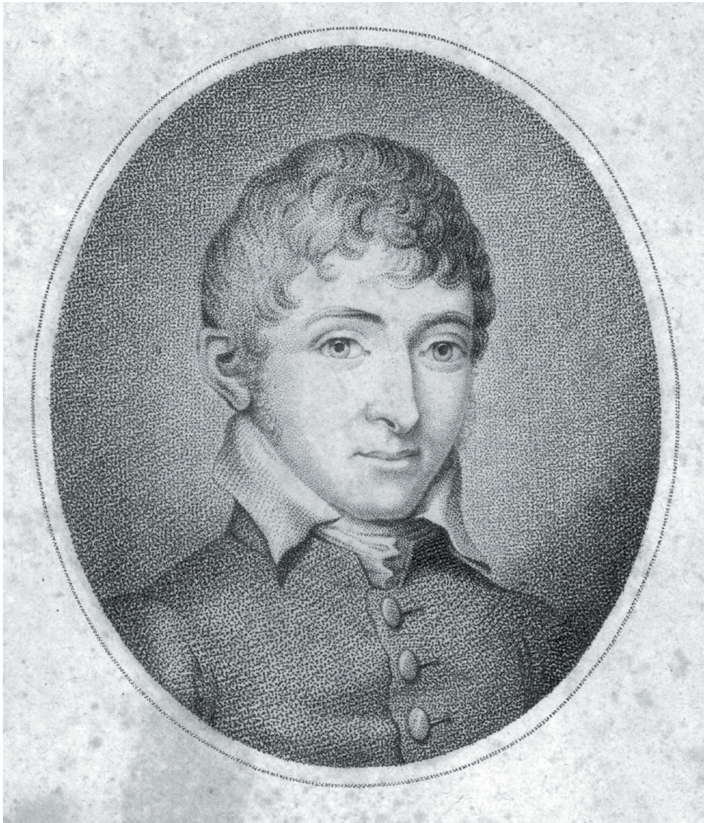
Fig. 1: Samtidigt portræt af Rasmus Rask som ca. 30-årig.

manglende interesse for og viden om deres eget gamle sprog. Blandt de byer i Persien, som fik besøg af Rask, var Tabriz, Teheran og Isfahan. Rask blev to dage før ankomsten til Teheran sparket bevidstløs af en hest, men blev hurtigt klar igen og kunne fortsætte rejsen. I Persepolis stiftede Rask i begyndelsen af juni 1820 bekendtskab med kileskriften