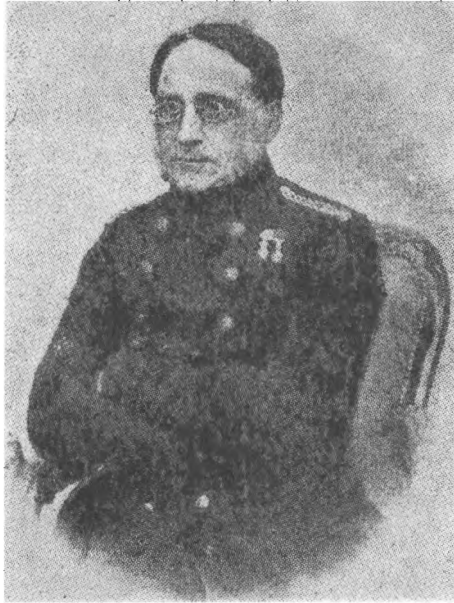
Kaptajnløjtnant Magnus Suenson.

anledning af rygter om, at han ville flygte. (Man har åbenbart frygtet, at han ville medtage kassebeholdningen) 62 .