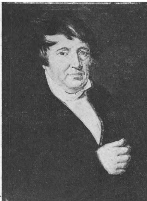
Ferdinand Esselbach († 1841). Portræt på Fodfolkskasernen i Haderslev.

»Stadt Hamburg« blev opført i palæstil med facade ud mod Lollfuss 4 . »Harmonien«s medlemmer ydede et byggelån på 4800 rdl., fordelt på 30 panteobligationer à 160 rdl. 5 .