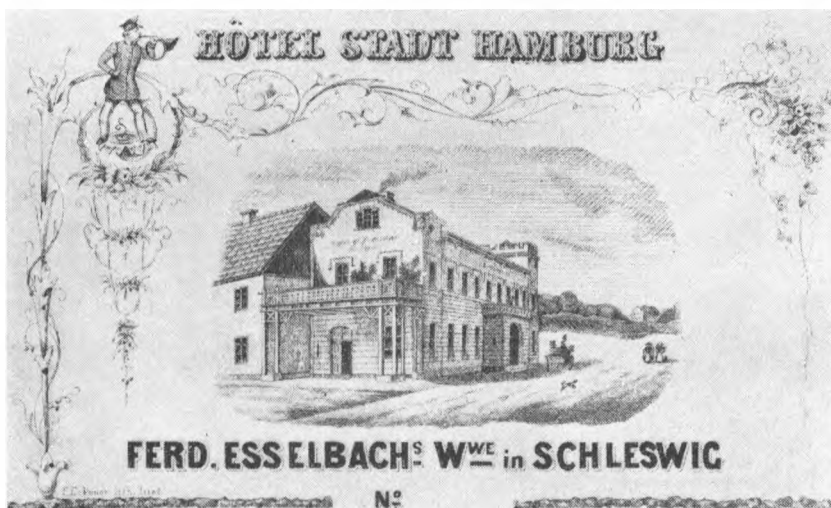
Esselbachs hotel ved midten af forrige århundrede (set fra syd). Efter samtidigt stik, gengivet på en af hotellets tegninger.

var dog muligvis hentet andetsteds fra og blot anbragt interimistisk.