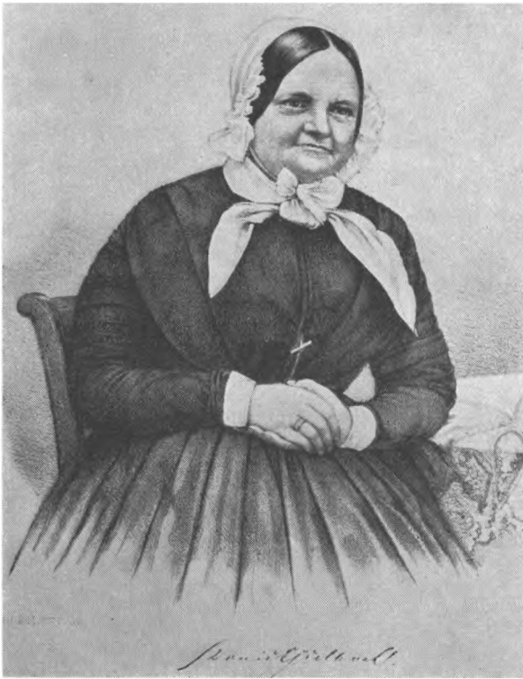
»Tante Doris«. Lithografi på Frederiksborgmuseet.

vognmester Holtermanns ivrige protest en wienervogn, der skulde føre kaptajn Chabert's og kaptajn Krabbe's hustruer og børn til Flensborg 48 .