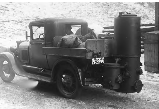
Gasgeneratoren betød at man kunne udnytte den gas, der er i træet, når det brænder og dermed erstatte den sparsomt tildelte benzin. Det kostede til gengæld ganske store skovområder. Fotografi fra ca. 1942.