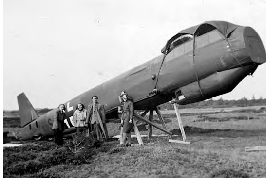
Fly-atrap under opbygning i Melbylejren under krigen.

Straks efter besættelsen den 9. april rykkede tyskerne nemlig ind i Melbylejren og begyndte kort efter en hektisk byggeaktivitet. Der blev bygget adskillige nye mandskabsbarakker, køkkenfaciliteterne blev udvidet, og ude på selve skydeter-rænet støbte man en mængde små beton-bunkers, der var åbne på den side, der vendte ud mod stranden og havet. De blev camoufleret med græstørv. Fra disse bunkers med løbegrave til hver side kunne man betjene forskellige bevægelige skydemål. Desuden blev der tæt ved lejren bygget et højt observationstårn på en solid tømmerkonstruktion. To andre observationstårne blev opført ude i klitterne med et par hundred meters afstand. Midt imellem disse anbragte man et stort fast skydemål, der skulle beskydes af lavtflyvende jagerfly med maskingeværer. Det bestod af lange flade lodrette brædder med mellemrum imellem, så vinden kunne fare igennem. De var hvidmalede og dannede en nøjagtig silhouet af en stor fragtdamper. Længden var mindst hundrede meter, og op til »skorstenens« øverste kant var der vel 15-20 meter. Ned over dette mål dykkede så Messerschmitt jagere eller lette to-motors Heinkel bombemaskiner og affyrede deres maskingeværer. Bagef-