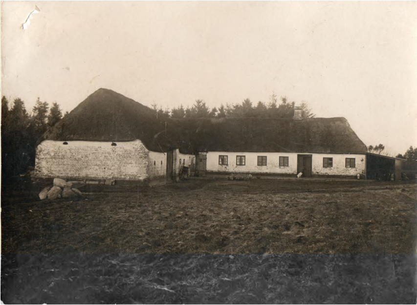
Risbjergvej 49, Drantum

HEFTE NR. 5, Hyvild , Drantum og Risbjerg