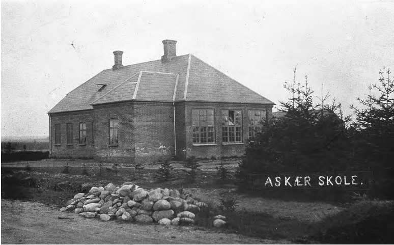
Askær Skole anno 1905