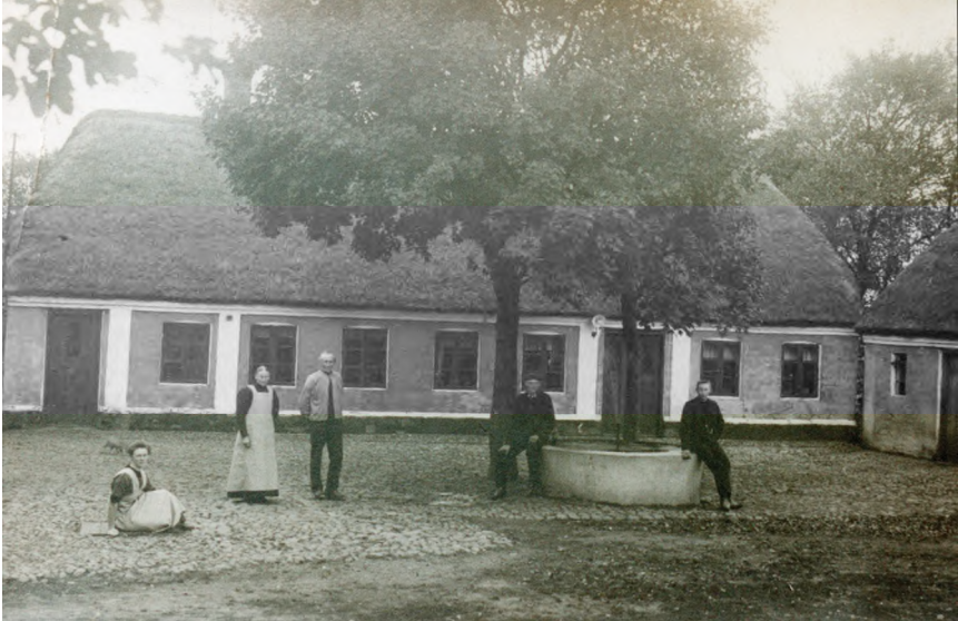
Skerrisvej 15 anno 1918