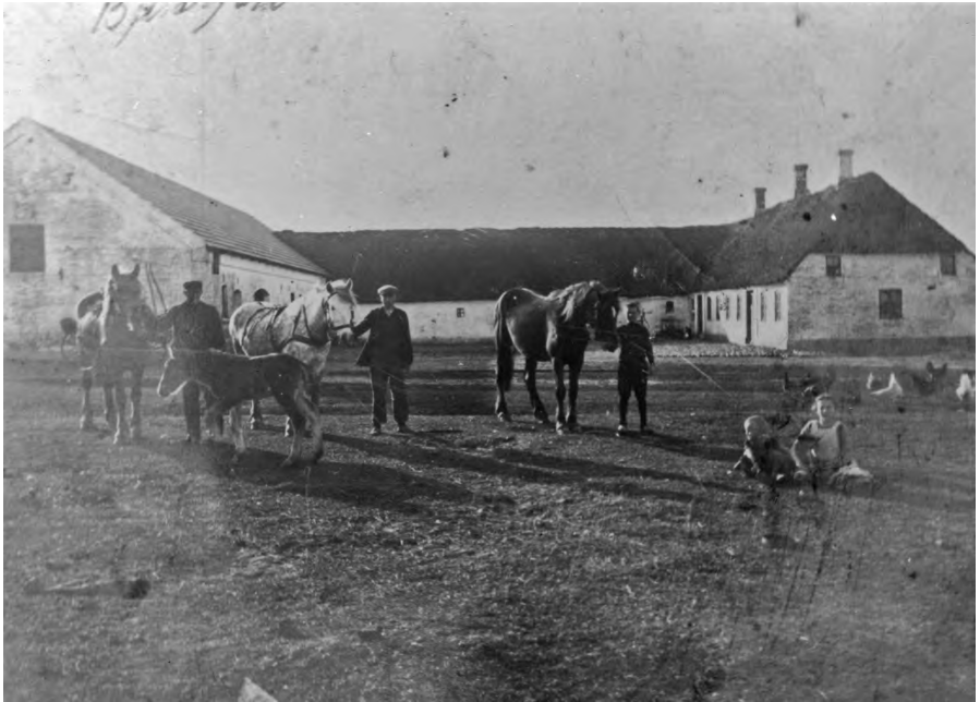
Sandfeldbjerregård, Sandfeldvej nr. 47, Sandfeld.