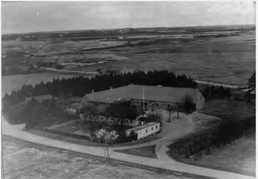
Lille Sandfeld, med det gamle stuehus. Bemærk brunkulslejerne i baggrunden af billedet. Gårdens historie kan føres tilbage til 1664. Den har bl.a. i 7 generationer tilhørt samme slægt, fra o. 1780 indtil 1993.