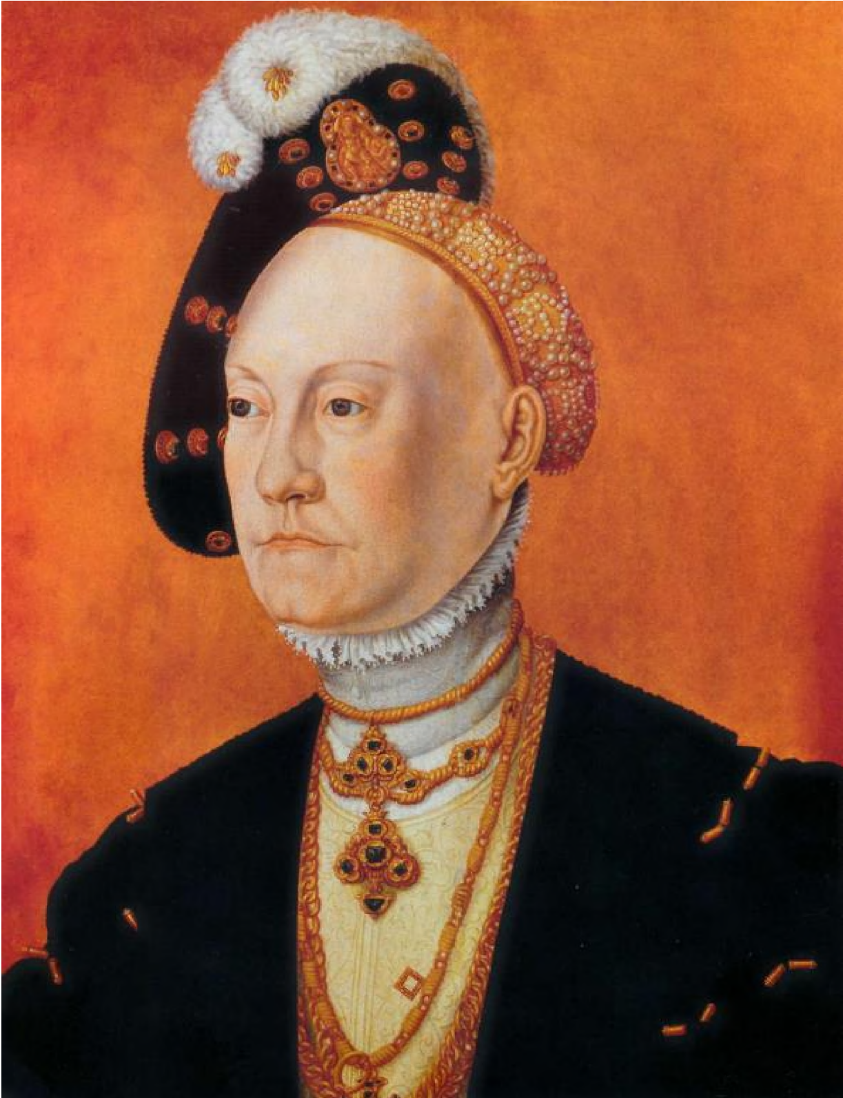
Dronning Dorothea, 1550, 47 år. Maleri af Jacob Binck, Det Nationalhistoriske Museum, Frederiksborg. Efter Jensen 2007.