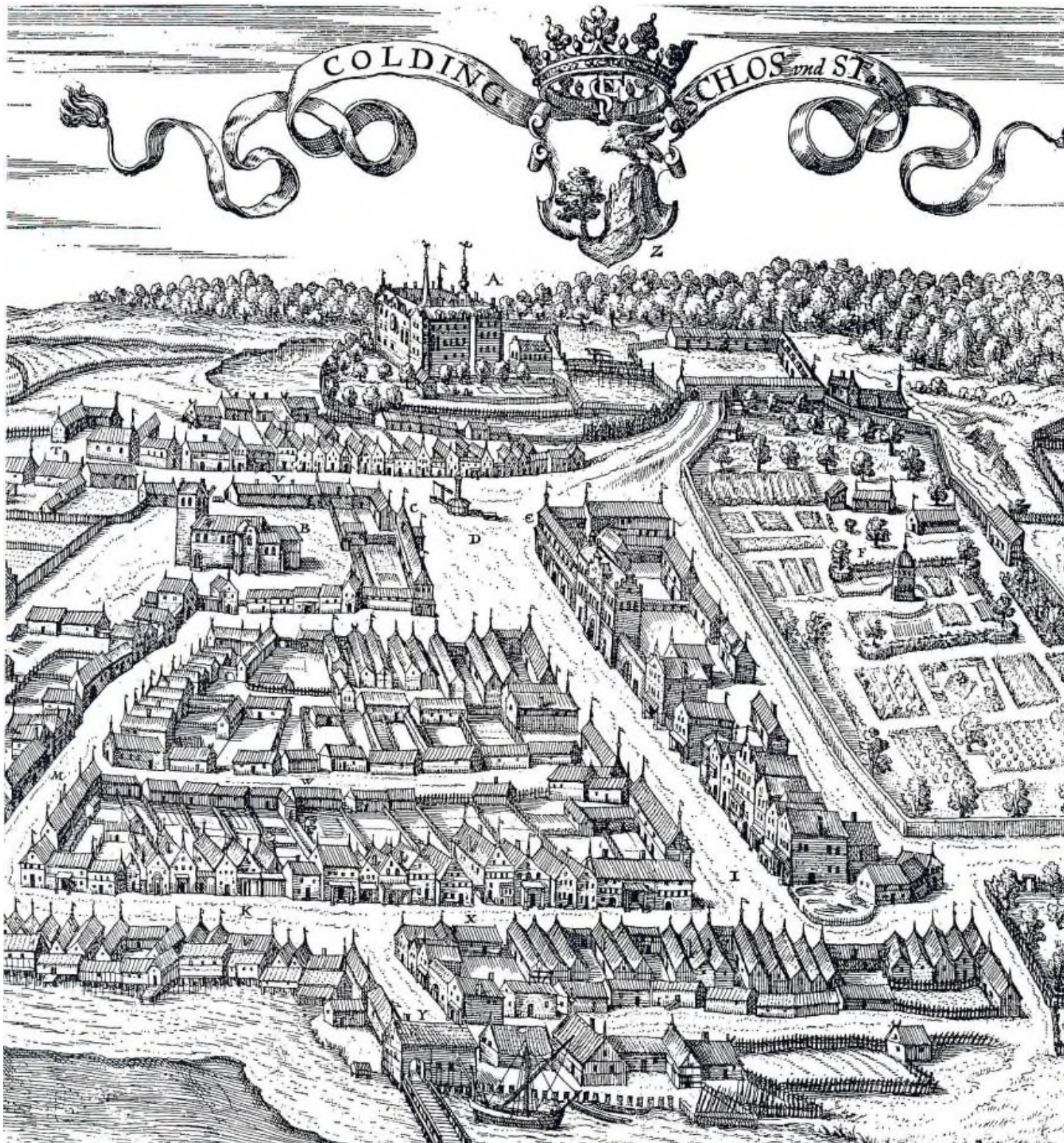
Prospekt over Kolding, 1587. Øverst i billedet (nord) slottet. Mod øst slotshaven. I midten torvet og rådhuset, og længere mod vest Skt. Nikolaj kirke. Nederst i billedet (syd) broen over Kolding fjord, hvor toldstedet lå. Hogenberg og Braun 1597.