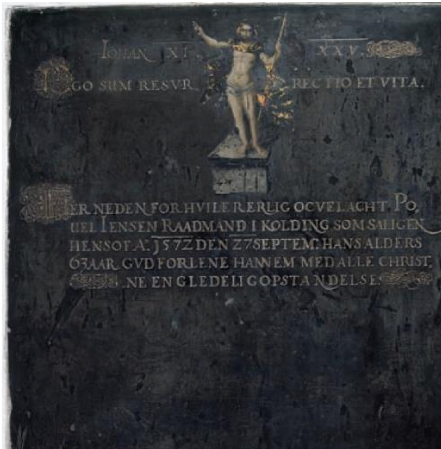
Povel Jensens epitafium, 1616