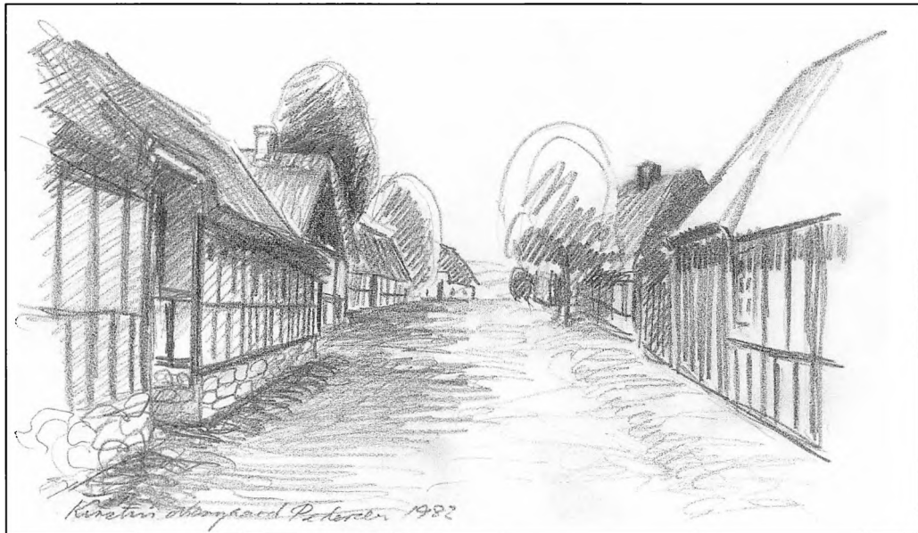
Tåstrup Bygade, set mod nord. Efter postkort fra ca. 1910. Tegning af Kirstin Nørgård Pedersen 1982.

I øvrigt var det ifølge loven nærmeste mandlige slægtning, som måtte påtage sig hvervet som værge eller formynder for børnene ved forældrenes død, vel at mærke hvis vedkommende var »vederhæftig«, hvilket betød at han skulle være både til at stole på og desuden være økonomisk