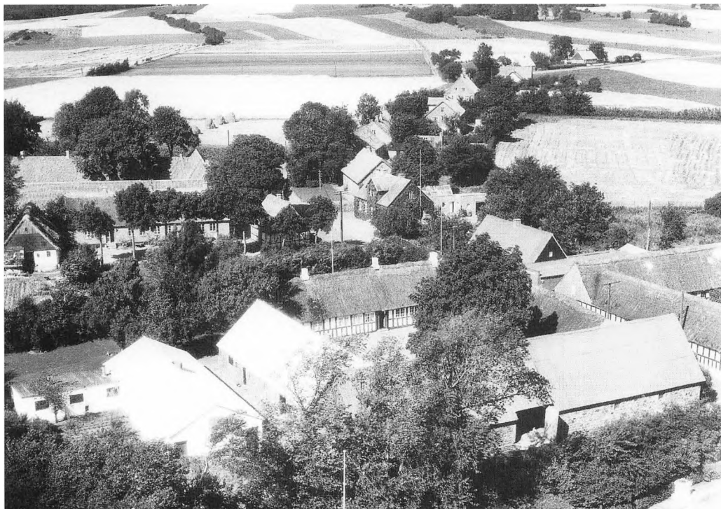
Udsigt over Tåstrup by fra syd. I forgrunden den nuværende matrikel nr. 3 Stensgård og umiddelbart til højre for denne matr. nr. 5 Agerskov. Mellem de to gårde løber landevejen.

Forfatternes samlede undersøgelser om Tåstrupgårdene omfatter alle byens 10 gårde. 17 Den er ført helt frem til i dag, men i det følgende er ejeroplysningerne kun medtaget til omkring tidspunktet for 1844-matriklens ikrafttræden.