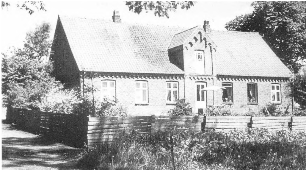
Blandt de gårde, der blev udflyttet fra landsbyen sidst i 1800-årene var som nævnt Kirstinelund., hvis nye stuehus blev opført i grundmur med elementer af tidens historiske stil.

Else Rasmusdatter døde først, 79 år gammel, i 1738 og boede som aftægtskone hos sønnen Jens Pedersen Søgård, som må formodes at have overtaget fæstet kort tid efter faderens død, for det er ham der er indskrevet i krigsportionsjordebogen fra 1718. Gården havde da 40 fag bygning, men de betegnes som værende slette.