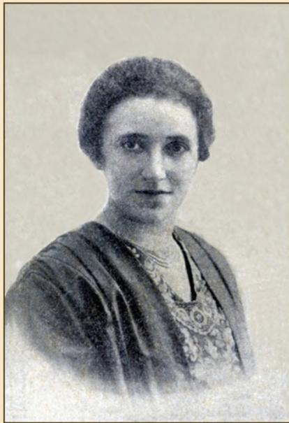
Pigen fra Kamptrup, som frelste mange Landsmænd.