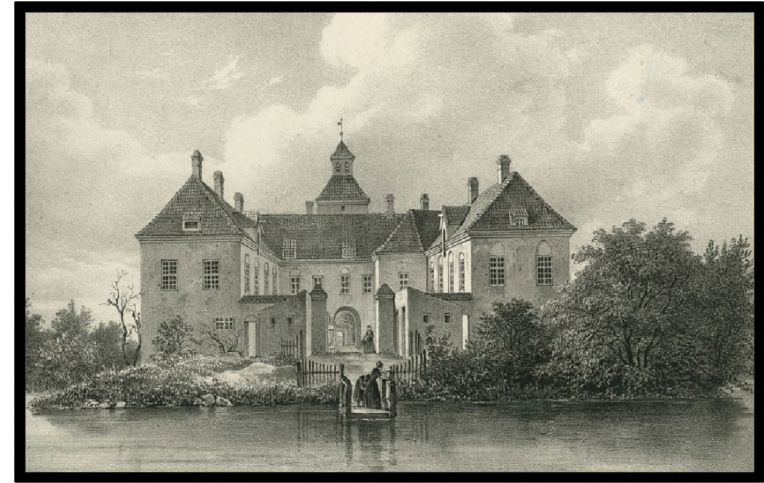
Mejlgård ligger på det nordlige Djursland i Glæsborg sogn, Randers amt.

Hvis det ikke var handel med ejendom, var det andre ting han gik op i.