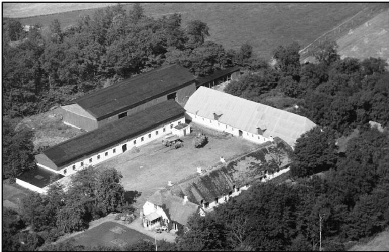
Ingerslevgård omkring 1946