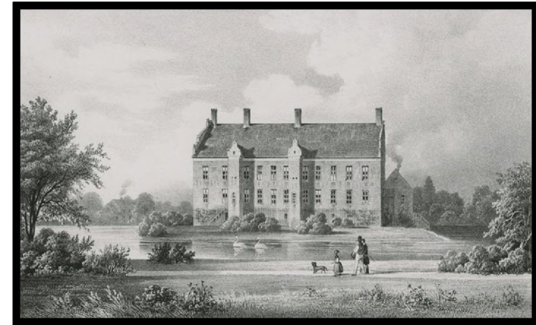
Gyldensteen ligger øst for Bogense i Nørre Sandager Sogn, Nordfyns Kommune.

Han fik Kgl. Bevilling til at sidde i uskiftet bo. Dateret 10.8.1764.