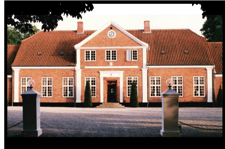
Tustrup Hovedgård, Hørning sogn Randers amt

Fremlagt og læst for Retten paa Nørre Jyllands Lands-Ting, Onsdagen den 20 Juni 1787, under No. 3.