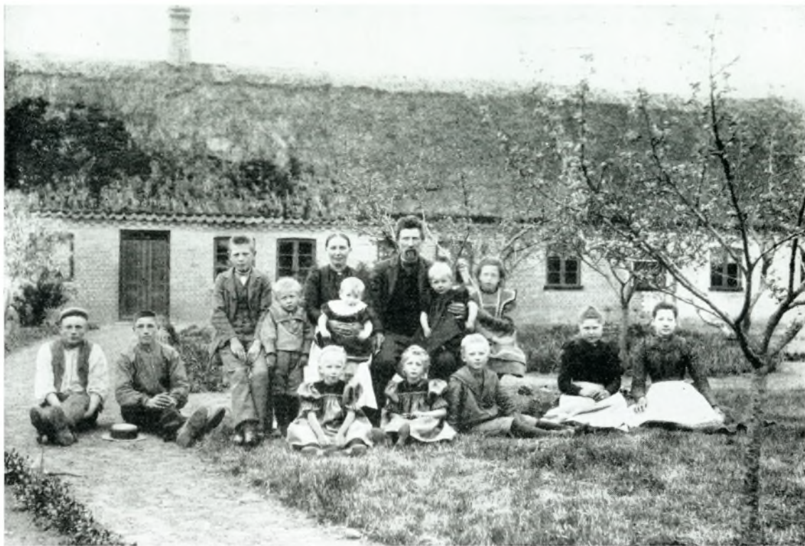
Hjemmet i Grønnegyden