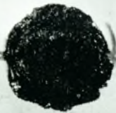
Det gamle Skøde