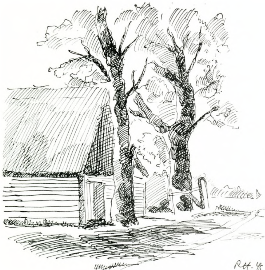
Det gamle Skovled ved Eghoved