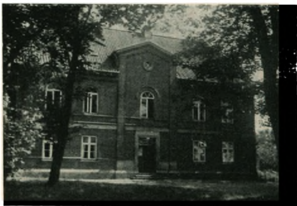
Tinghuset, nu Forsamlingshus.

I det nye, grødefulde folkelige Arbejde, som nu tog sin Begyndelse i Nordslesvig med den Ungdom, der valgte at blive i Hjemstavn og værne Fædres Jord og Fædres Arv, var Visby med fra første Færd. Af alle de Forsamlingshuse, som nu skød frem, var Visby Nr. 2 i Rækken og blev i mange Aar et Samlingssted for Danske fra en vid Omkreds.