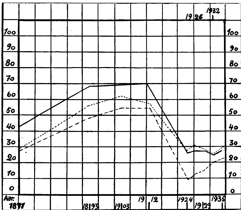
— Første Gruppe. - - - - - Anden Gruppe. — Tredie Gruppe.

Men der er visse Træk i Udviklingen, som nødvendiggør, at Interessen samles om Situationen, som den har formet sig, og som den former sig for Øjeblikket. For bedre at gøre den anskuelig illustreres Udviklingen nedenfor ved Hjælp af en Kurve, som for hver af de tre Grupper Vedkommende tager sit Udgangspunkt i Resultatet fra det tyske Rigsdagsvalg i 1871: