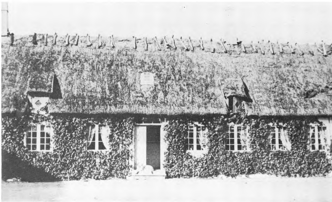
Hjertebjerg Præstegård. Møn.