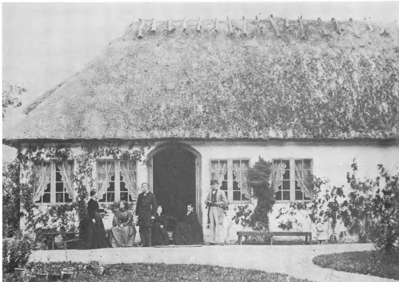
Salsdøren; set fra haven.