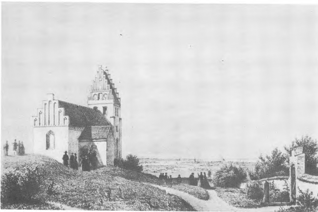
Elmelunde Kirke. Møn.