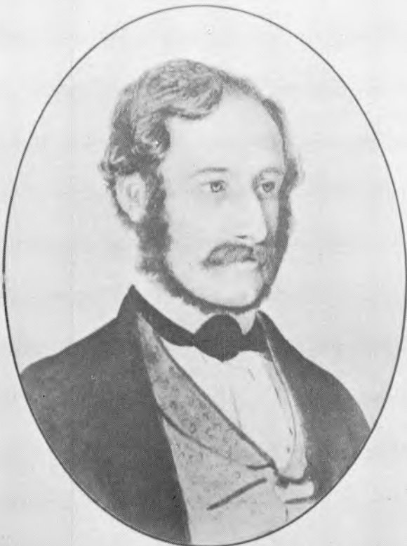
GEORG ANTON KROHG. Tegning af Ad. Tidemand.