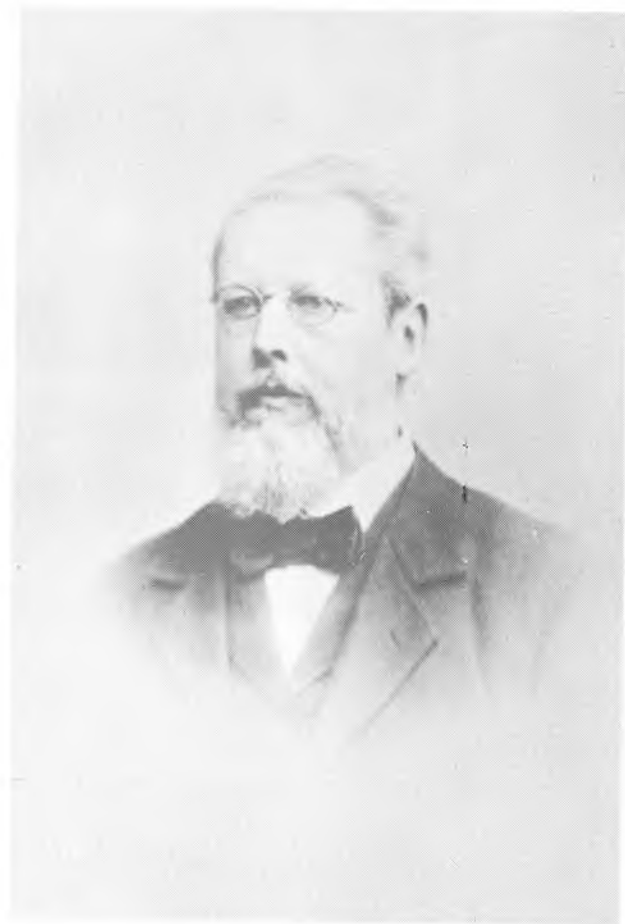
WASHINGTON von der HELLEN.