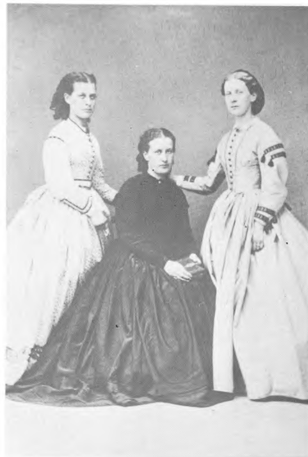
Tre søstre 1864.