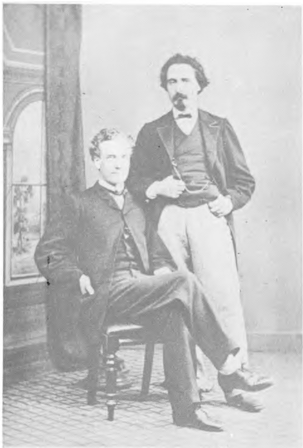
To svogre 1864-65.