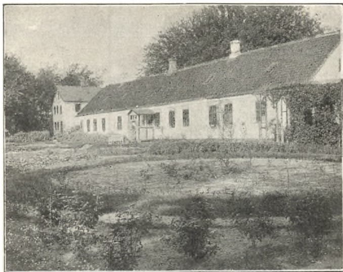
MØLTRUP, SET FRA HAVEN