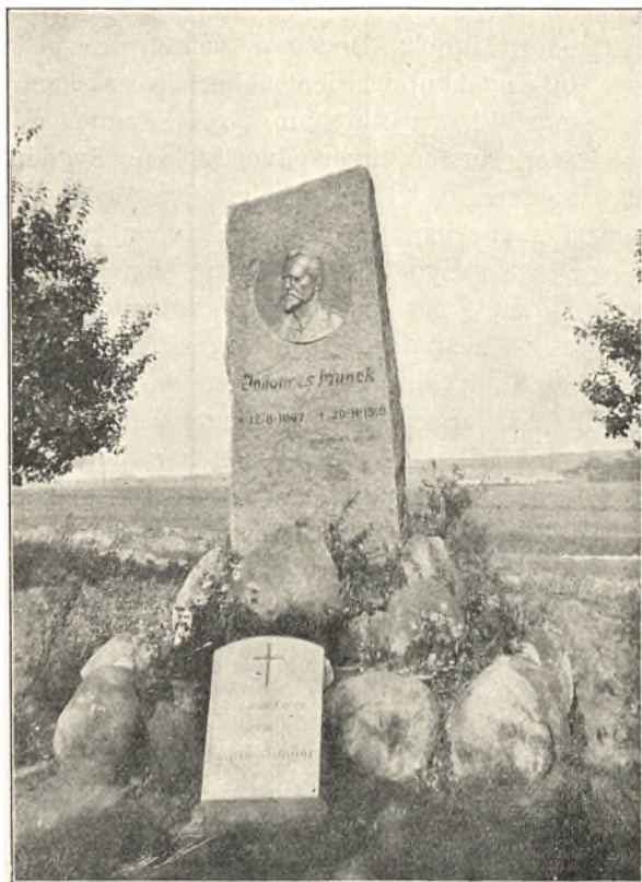
MINDESTENEN OVER JOHANNES MUNCK