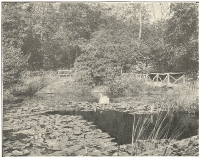
VED AAEN I MØLTRUP HAVE

Og fordi det var Grundtonen hos ham, at han forstod sit Liv som en Tjeneste i Lydighed mod sin Herre, saa var han ogsaa en meget frimodig