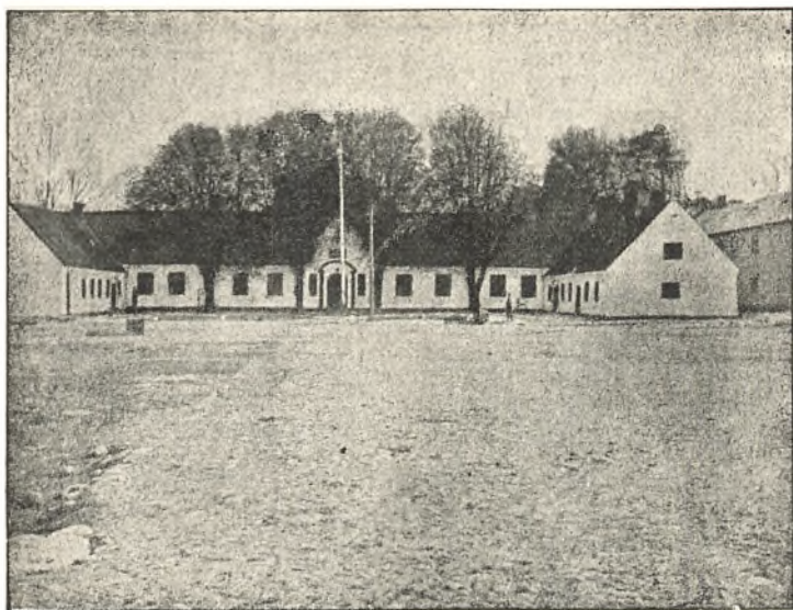
MØLTRUP, SET FRA GAARDEN