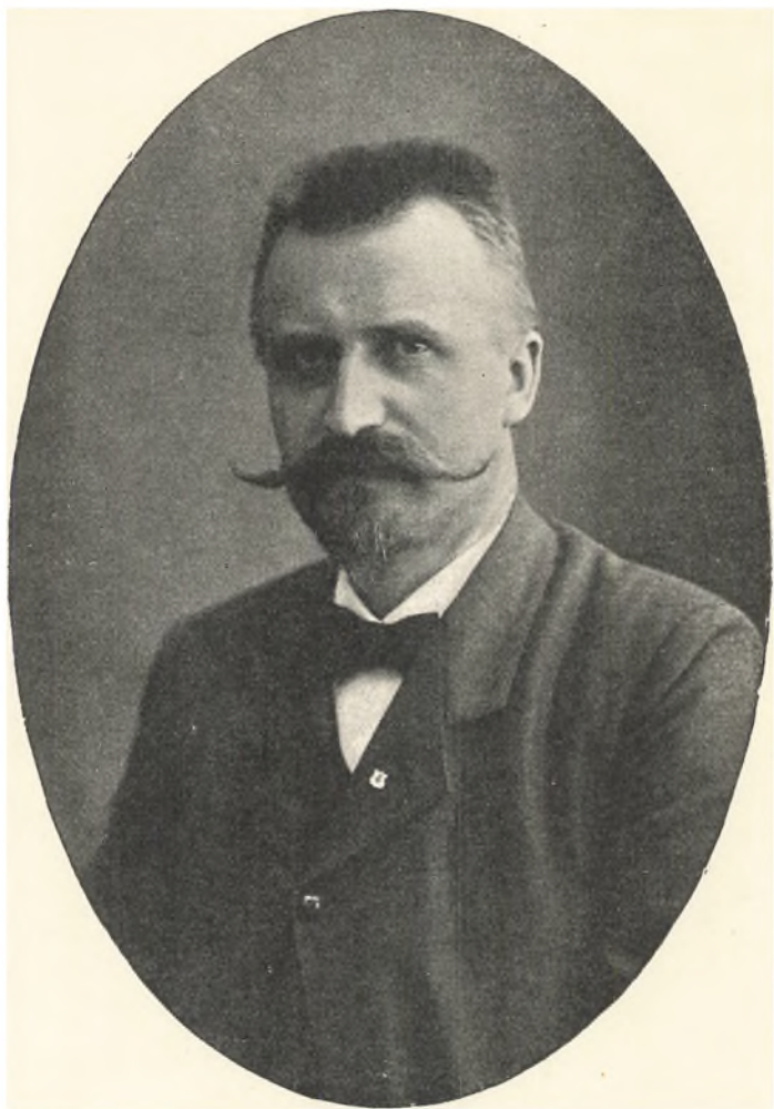
JOHANNES MUNCK FØDT 1867, DØD 1919