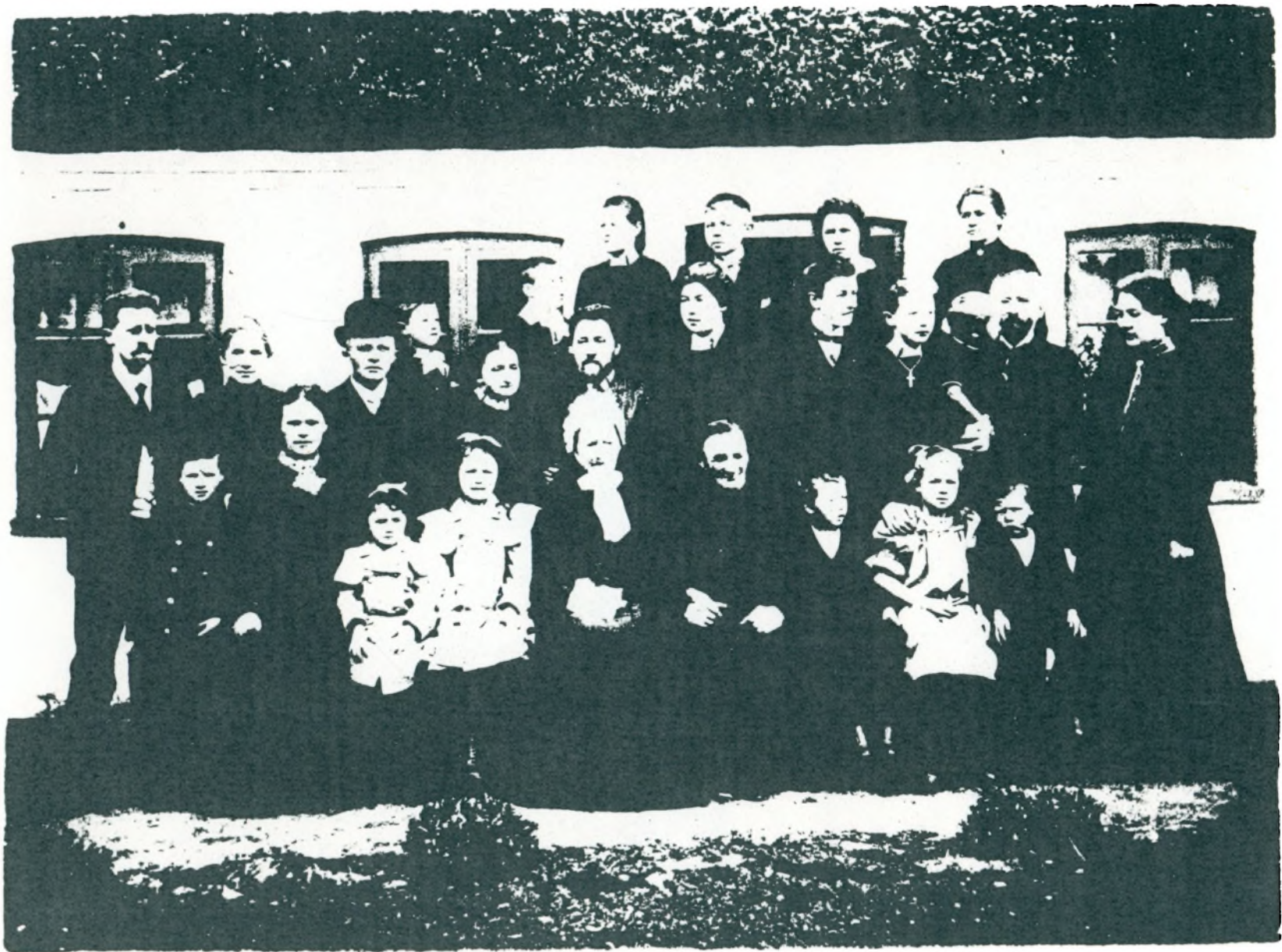
Fam. Farverdres Guldbrændingsdag den 28 April 1905.