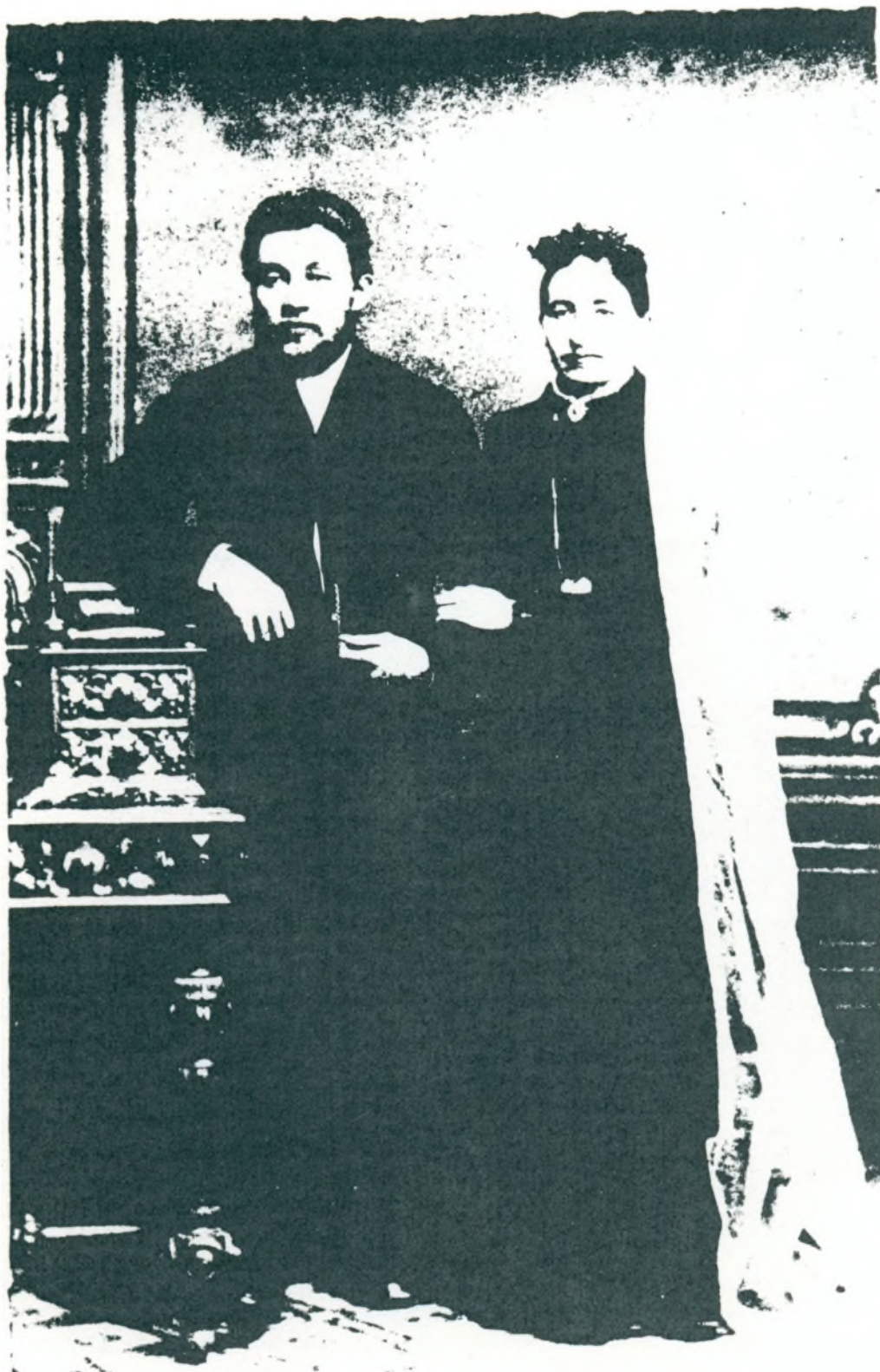
Far og Mor paa Bryllupsdagen 10. April 1886.