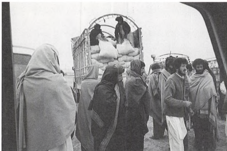
Uddeling af mel og olie til flygtninge.

dom i undervisningsøjemed. I haven til vores lille klinik har vi oprettet en skole for 50 drenge. De kommer fra de nordlige provinser, hvor de taler en speciel dialekt og derfor har sprogvanskeligheder.