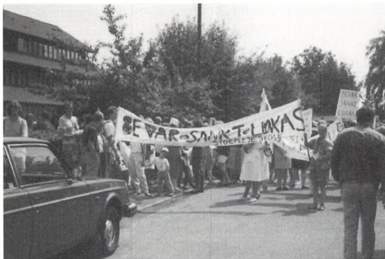
Demonstrationen starter fra skolen.

medlemmerne, men desværre ikke så meget, at den på forhånd aftalte beslutning blev ændret.