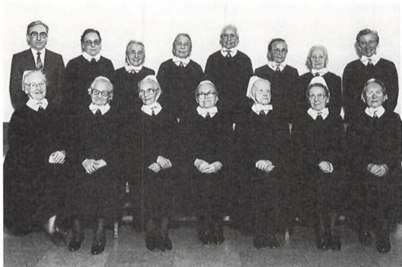
Årets jubilerende søstre.

levende hus, der både kan summe af travl aktivitet og give mulighed for stilhed.