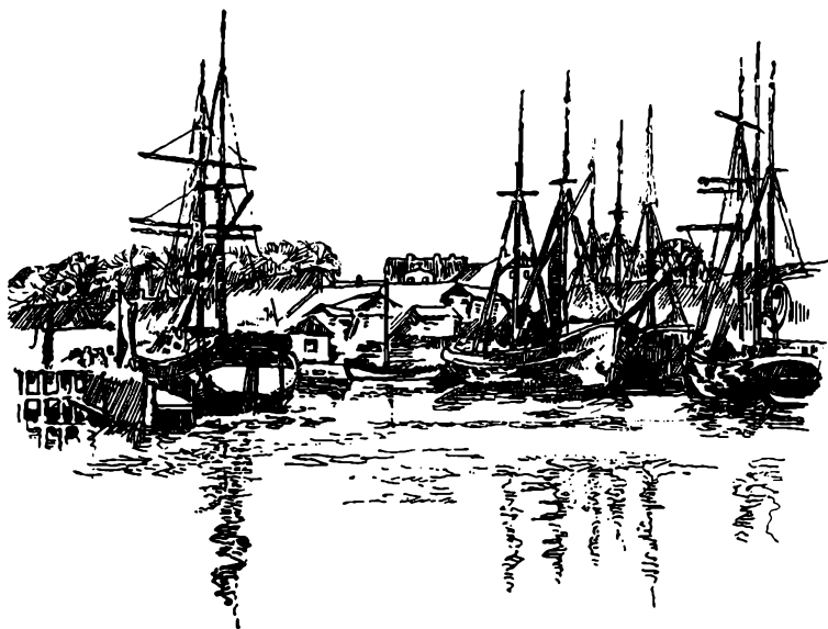
TØMMERSKIBE I HAVN

med største Iver op i Arbejdet paa Modernisering af Havneforholdene ved Frederikssund, han noterer for 1843: