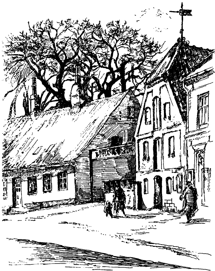
ASSESSOR RICHARDI'S GAARD MED DEN GAMLE LAGERBYGNING