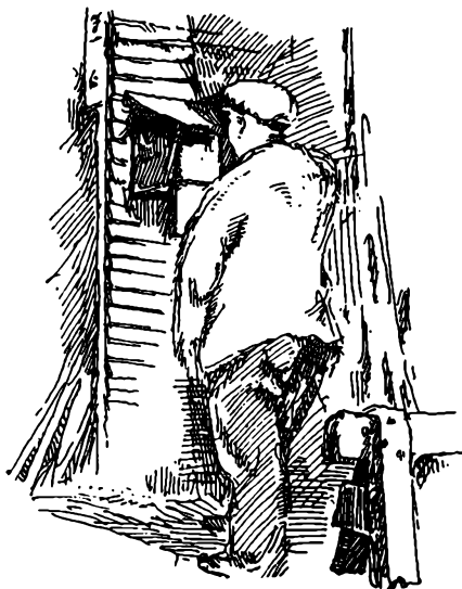
FJERTELEFONEN KALDER —

Dette er nok en Videreføring af tidligere Tiders paa-begyndte Specialisering; men samtidig er de sidste Tiaars afgørende Vending i hele Byggeteknikken taget i Betragtning. Udviklingen har ført med sig, at nye Byggeformer