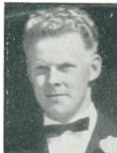
E. Moeslund automobilforhandler Ans By