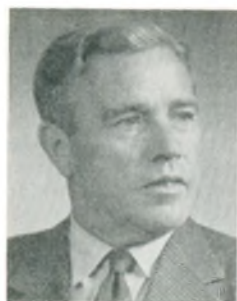
S. Petersen automobilforhandler Kbhvn. N.