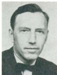
A. Jensen automobilforhandler Vojens