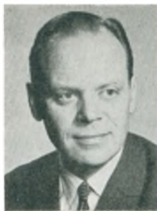
Aa. R. Uth produktionschef Kbhvn. N.