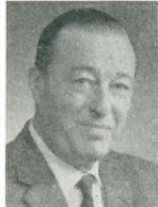
F. Thejll direktør Kbhvn. N.

taget i kurser på Teknologisk Institut, Kbhvn. 1926, Ford kurser 1925, studierejser t. Frankrig, England og USA, svend h. læremesteren og h. autoforhandler M. Olesen, Tarm, etabl. s. automobilforhandler i Silkeborg 1937; medl. af C.A.D., af D.A.F.'s voldgiftsret s. 1951, af Dansk Maskinhandlerforenings brugttraktor-udvalg s. 1955, af best. f. ND forhandlerforeningen s. 1947; tildelt ND diplom f. salg; arbejde: aut. ND forhandler m. tilhørende reparationsværksted og salg af reservedele, forhandler f. Nordisk Tractor Comp. (også landbrugsmaskiner), reparationsværksted f. automobiler.