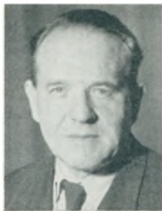
H. Brinks automobilforhandler Kbhvn. Ø.