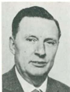
Aa. Bæk grosserer Arhus