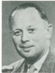
E. Rolsted motorcykel- og automobil- forhandler Holbæk