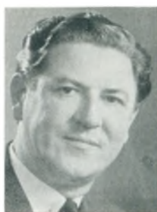
H. Busch automobilforhandler Kbhvn. V.