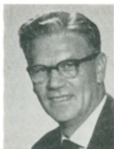
Aa. Himmer direktør Randers