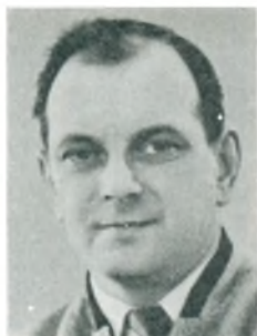
G. Otte automobilforhandler Hobro