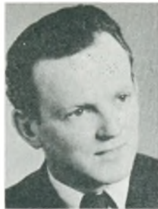
A. Liss automobilforhandler Åbenrå