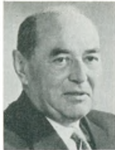
V. Eivil automobilforhandler Roskilde