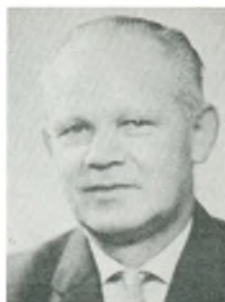
C. H. Jensen automobilforhandler Slagelse