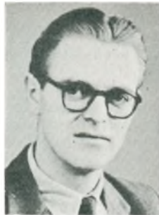
Aa. C. Pahuus automobilforhandler Bramminge