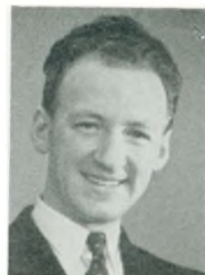
K. Egeberg automobilforhandler Skive

till. vulkanisering, slidbanefabrik og salg af auto- og traktorgummi.