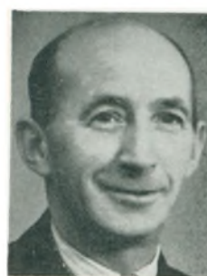
A. Bjørn automobilforhandler Kjellerup

& Co. A/S, Odense 1929-43, etabl. s. automobilforhandler i Odense 1943; medl. af D.A.F.; arbejde: aut. forhandler f. Erla automobiler og Scannobil m. tilhørende specialværksteder og ertservedelslagre, alm. autoreparation, opretningsarbejde.