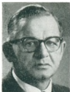
J. Larsen automobilforhandler Helsingø