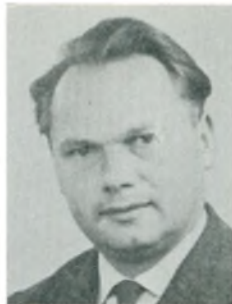
E. S. Bendtsen automobilforhandler Herning