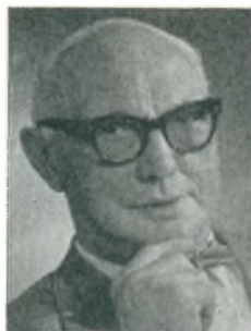
P. Larsen grosserer Kbhvn. F.