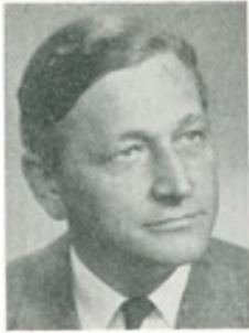
V. Lærkes direktør, cand. jur. Kbhvn. K.