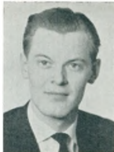
C. N. Bonde automobilforhandler Haderslev