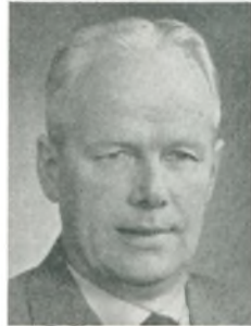
L. Rold automobilforhandler Års