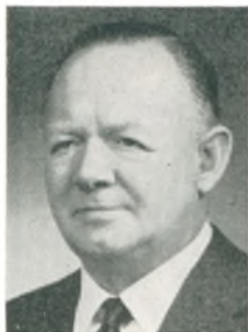
T. Strand automobilforhandler Kbhvn. Ø.