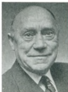
V. Frederiksen automobilforhandler Odense