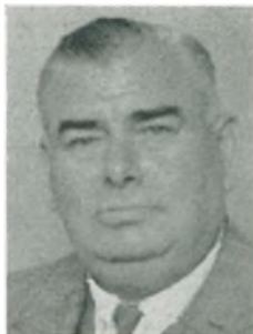
H. C. Puck grosserer Kbhvn. V.