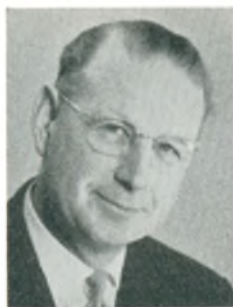
A. Madsen automobilforhandler Rødby