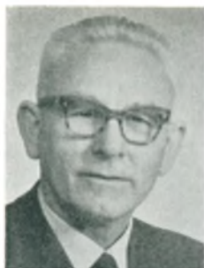
A. Nielsen automobilforhandler Rudkøbing