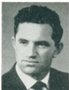
H. Lund automobilforhandler Abenrå