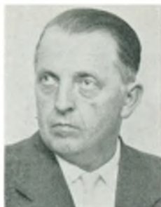
Aa. Blands automobilforhandler Horslunde