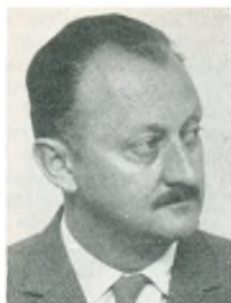
B. Isle direktør Kbhvn. V.