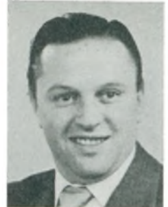
Aa. Madsen mekanikermester Herning

de: aut. GM forhandler m. tilhørende specialværksted og reservedelslager, eneforhandling af AC tændrør og oliefiltere, Carter karburatorer og benzinfiltre, Pedrick stempelringe, New Departure kuglelejer, Hyatt rullelejer, Duquesne dækmonteringsanlæg, Dexion byggeprofiler, Transpar vindspejlsvaskere m. m., Cityafd.: Gothergade 49, Kbhvn. K., filialer i Glostrup og Herlev.