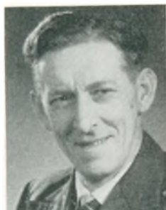
P. Sjølland automobilforhandler Tofthund