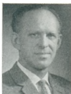
G. Olsen grosserer Vanløse