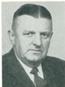
E. Andersen fabrikant Fruens Bøge