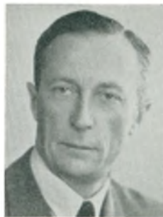
S. Bjødstrup automobilforhandler Odense