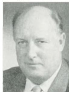
P. Kirchhoff grosserer Kbhvn. V.

Laug; arbejde: maskinfabrik, cylinderservice, reparation og ombygning af maskiner.