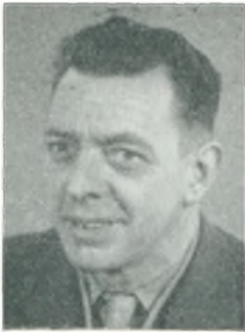
H. F. Andersen automobilforhandler Eskilstrup