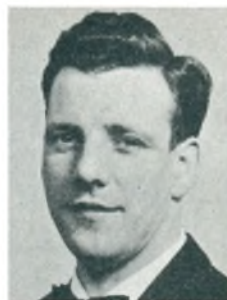
B. Edelholt automobilforhandler Horsens

mark; arbejde: fremstilling af karrosserier t. køle- og lastvogne og campingvognen »MKP«.