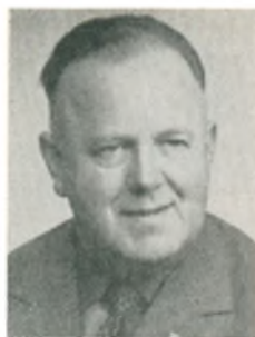
A. Østerdahl automobilforhandler Grauballe