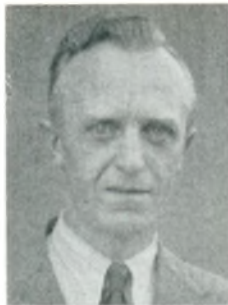
C. Hansen automobilforhandler Horsens