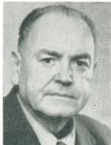
A. Rabenhøj automobilforhandler Nykøbing M.