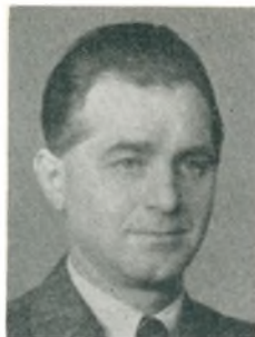
V. Tornhøj automobilforhandler Tryggev