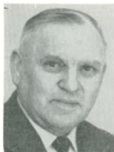
R. Hoffmann automobilforhandler Nakskov