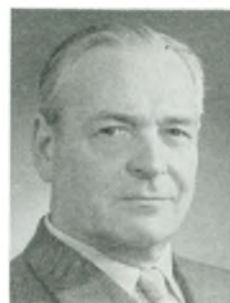
E. Happel automobilforhandler Slagelse

Tyskland, driftsleder h. faderen s. 1959; medl. af D.A.F. og Dansk Arbejdsgiverforening, medl. af Rotary International; arbejde: aut. Ford forhandler m. tilhørende specialværksted og reservedelslager, alm. autoreparation.