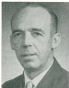
N. Rose automobilforhandler Horsens