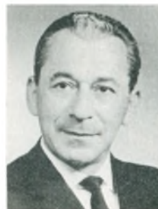
S. Petersen automobilforhandler Helsingør

ningsarbejde, auto- og traktorreparation, Shell service, smøre- og vaskehal.