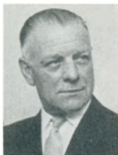
H. Nielsen automobilforhandler Hillerød