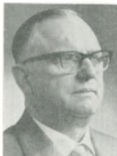
Aa. Heidemann automobilforhandler Århus