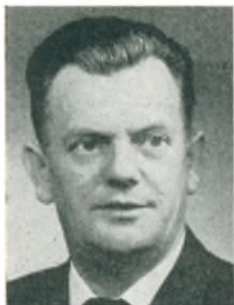
K. Thunø automobilforhandler Ballerup