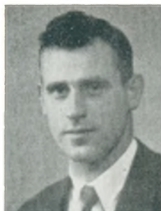
V. Aa. Lundorff automobilforhandler Skjern