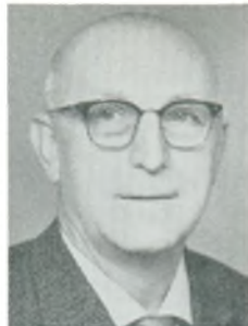
A. P. Hansen automobilforhandler Fredericia