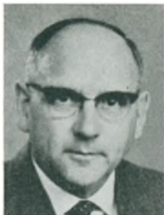
G. Jensen automobilforhandler Sorø