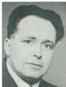
Aa. S. Eeg mekanikermester Hovedgård