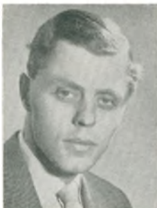
K. Wæver automobilforhandler Maribo