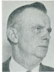
H. Cassø automobilforhandler Brønderslev