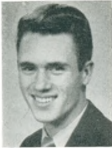
S. Petersen automobilforhandler Abenrå