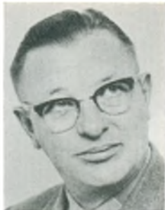
A. Ranch mekanikermester Sønder-Onsild