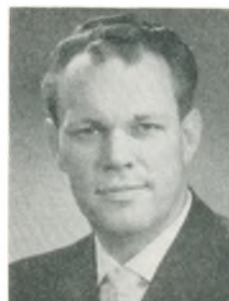
P. Ryander motorcykelforhandler Kbhvn. Ø.

Adr. Platanvej 7, Holbæk. Firma: N. P. Rolsted's Sønner, motorcykel- og automobilforhandlere, Labæk 12, Holbæk.