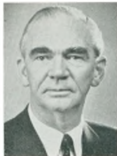
S. Brøchner automobilforhandler Vejle