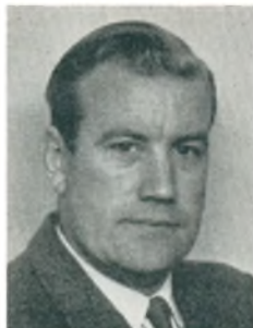
H. G. Nielsen automobilforhandler Kolding