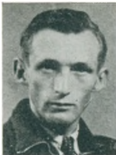
C. Toft motorcykelforhandler Ålborg