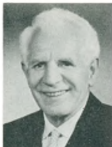
H. Møller fabrikant Kbhvn. V.