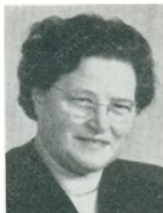
K. Demstrup frue Ans By