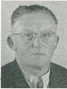
E. O. Slot automobilforhandler Varde