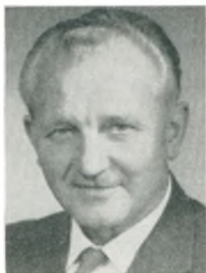
C. Petersen automobilforhandler Holte