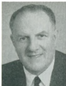
G. Hansen automobilforhandler Kjellerup