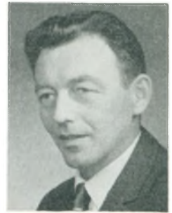
J. Andersen fabrikant Sønderborg

Håndværker- og Borgerforening; arbejde: aut. forhandler f. Bukh traktorer, underforhandler f. GM, reparationsværksted f. automobiler og traktorer, Shell service, smørehal.