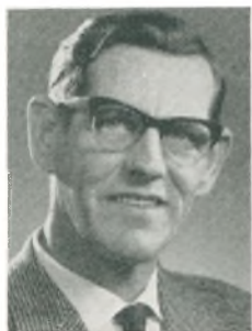
A. Precht-Jensen automobilforhandler Frederikshavn