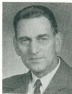
A. Reiths automobilforhandler Nykøbing F.