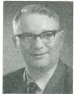
J. Jørgensen automobilforhandler Torp pr. Thisted

Karosseribyggerlauget i Storkøbenhavn, medl. af Kbhvn.s Automekaniker Laug; arbejde: aut. Mercedes Benz forhandler m. tilhørende specialværksted og reservedelslager, fremstilling af karrosserier t. omnibusser, brandsprøjter, ambulancer, last-, vre- og campingvogne, arbejde efter opgave.