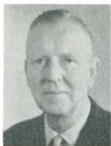
A. Fog automobilforhandler Kbhvn. V.