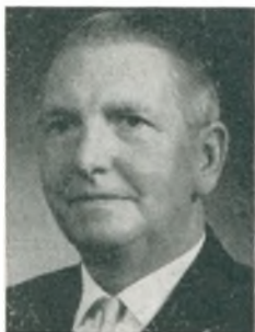
A. Lehrmann automobilforhandler Hårby