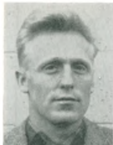
H. D. Pedersen automobilforhandler Nykøbing M.