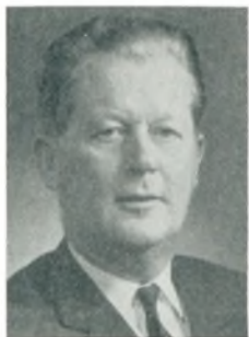
A. Bukkehave automobilforhandler Svendborg