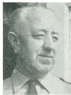
H. Bay benzinforhandler Abyhøj

ler m. tilhørende specialværksted og reservedelslager, Shell service, smøre- og vaskehal.