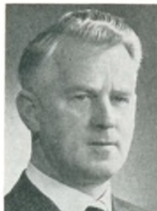
N. Kjær automobilforhandler Svendborg