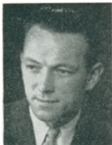
I. Nielsen automobilforhandler Skive