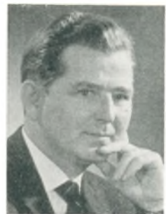
S. Nauerby automobilforhandler Svendborg

mobilhandel 1938; medl. af D.A.F. og C.B.D., af Brønderslev ligningskommission; arbejde: aut. ND forhandler (automobiler, traktorer og mejetærskere) m. tilhørende specialværksteder og reservedelslagre, auto- og traktorreparation, Esso service, smøre- og vaskehal.