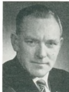
V. Jacobsen automobilforhandler Kolding

bejde: vulkaniseringsarbejde, slidbanedæk, salg af auto- og traktorgummi.