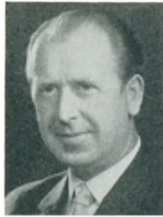
K. Andersen automobilforhandler Viborg