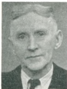
C. Krosgaard karrosserifabrikant Bedsted Thy