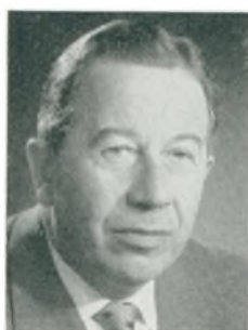
F. Bjerregaard grosserer Kbhvn. V.