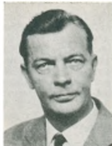
H. Tilling fabrikant, kaptajn Kbhvn. V.

brandfoged s. 1948; tildelt Falcks Redningskorps 10-års hæderstegn; arbejde: aut. Renault forhandler m. tilhørende specialværksted og reservedelslager, auto- og traktorreparation, dieselarbejde, opretningsarbejde, Shell service, N.P. flaskegasdepot.