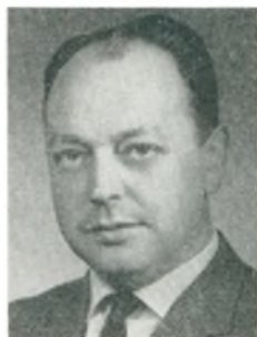
I. Larsen automobilforhandler Birkerød