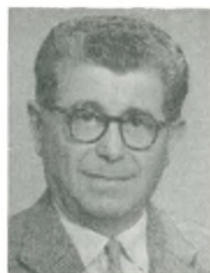
C. M. Jensen automobilforhandler Slagelse

biler, traktorer og entreprenørmaskiner, speciale: Domi og diesel.