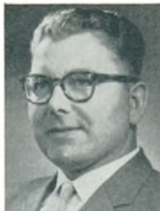
P. Borne automobilforhandler Sønderborg