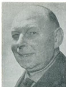
A. Clausen automobilhandler Århus