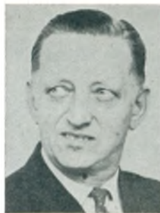
E. C. Bro automobilforhandler Lemvig