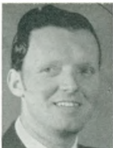
F. Christensen automobilforhandler Ars