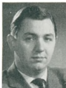
B. Schrøder automobilforhandler Haderslev