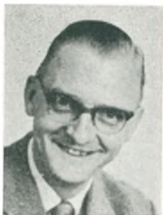
P. Lie automobilforhandler Hjallerup