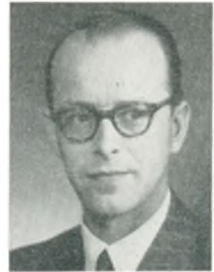
V. Loft generalsekretær, direktør Kbhvn. V.

mobilhandel 1955; medl. af C.A.D.; arbejde: aut. Domi forhandler m. tilhørende specialværksted og reservedelslager, alm. autoreparation, opretningsarbejde.