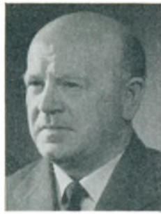
H. Elsing automobilforhandler Holstebro