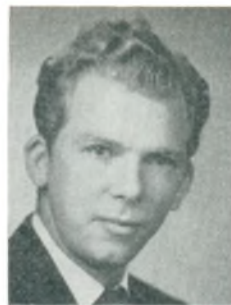
G. Andersen automobilforhandler Helsingør

arbejde: aut. GM forhandler, reparationsværksteder, afd. f. reservedele, brugtvognsafd.