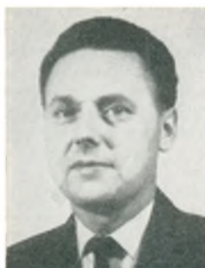
J. Nissen automobilforhandler Allingåbro