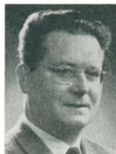
N. Linnebeck automobilforhandler Kbhvn. F.

delt Bilgummiværkstedernes Landsforbunds hærstegn.