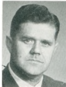
H. Sloth mekanikermester Højby Fyn