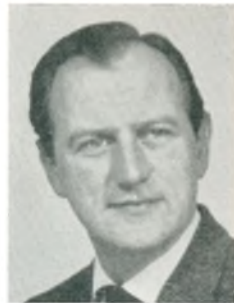
K. Olsen konsulent Kbhvn. V.