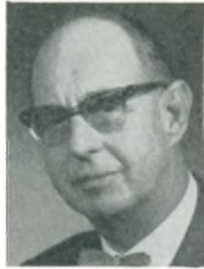
S. Rasmussen automobilforhandler Korsør