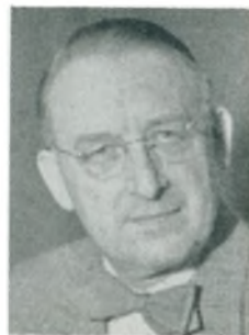
H. Ott mekanikermester Kbhvn. F.

tere, Heinckel scootere og cabinescootere m. tilhørende reservedelslagre.