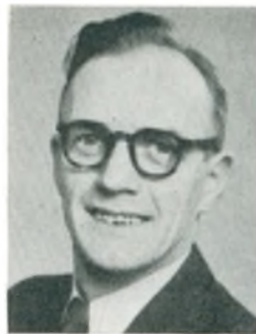
Aa. Nielsen automobilforhandler Års