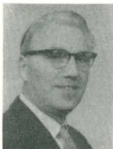
A. Holm auto-elektro- mekanikermester Køge