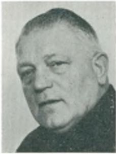
A. Geil fabrikant, mekanikermester Bagsværd