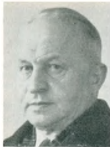
E. Christiansen automobilforhandler Holte