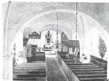
Fig. 12. Sønderborg S. Marie. Indre, set mod det nye orgelgavl. (1907)