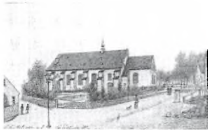
Fig. 10. Sønderborg S. Marie, Kirken efter 1867. Tegning af F. C. Müller. Museet på Sønderborg Slot (p. 2061).

I forbindelse med de forberedelser, der er i gang m.h.t. at få genåbnet de to vinduer i kirkens østgavl har vi ”forsket” lidt i vinduernes historie.