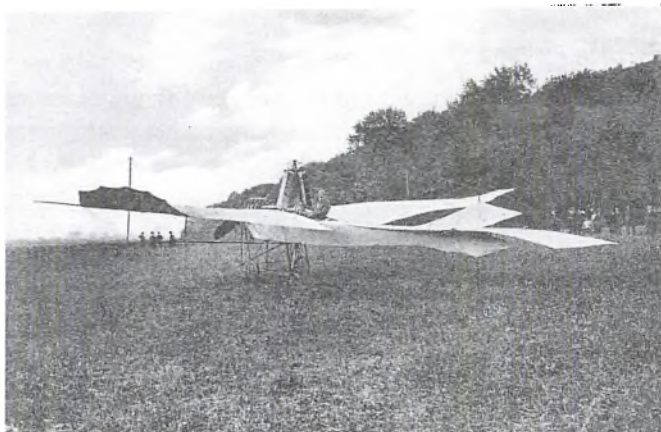
LOEW's flyver fotograferet på øvelsespladsen øst for Sønderborg.