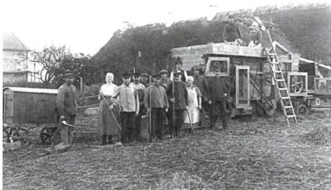
Tærskning på Kær halvø ca. 1930erne