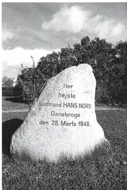
Mindestenen ved Strandpromenaden