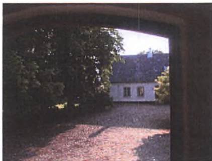
Et kig fra kornloftet ud på gårdspladsen