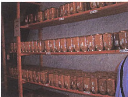
Forsøgskorn på lageret