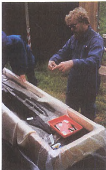
Andre fund fra mosen

Det var bare synd der ikke var flere med.