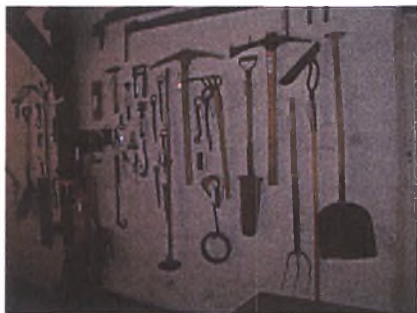
Forskelligt værktøj anvendt i tiderne