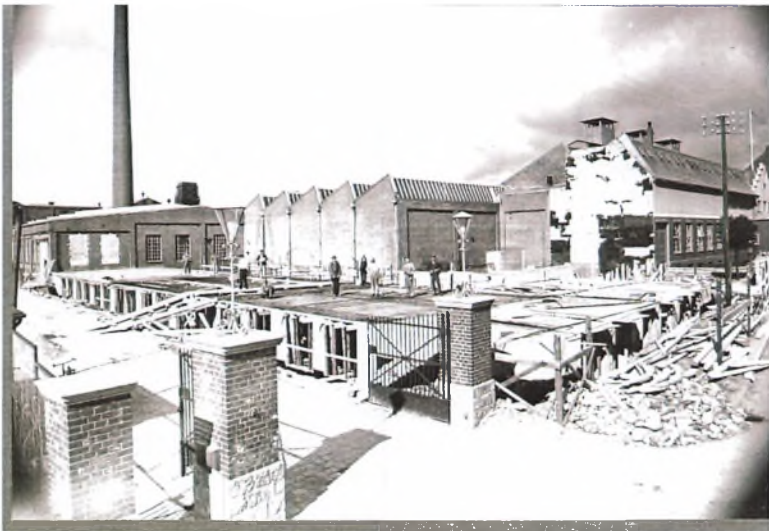
Det Nordiske Kamgarnsspinderi under udvidelse