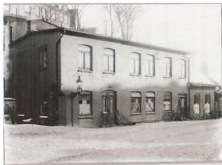
„Sønderborg Honning- og Sirupsfabrik, Ringgade midt i 1920.“