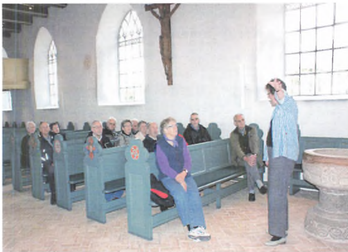
Besøg i Dybbøl Kirke