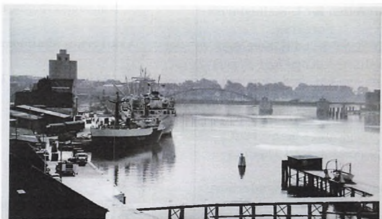
Sønderborg havn m. Kongebroen til højre