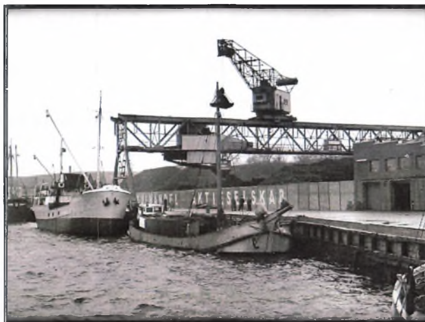
Kulhandel A/S's lager på havnen (Eet af mange billeder, arkivet lige har modtaget)