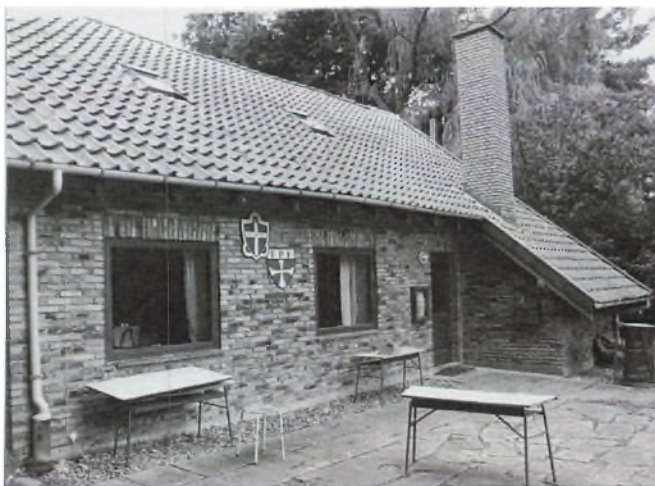
Spejderhytten på Ringgade. Som det ses, overtog FDF senere bygningen