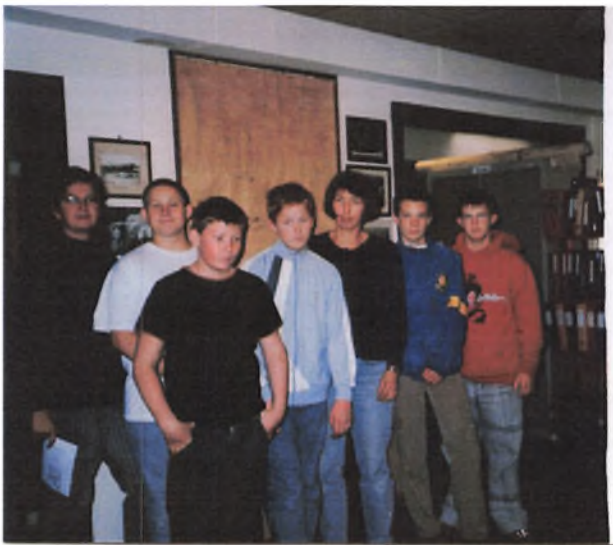
Skoleklasse på besøg i arkivet