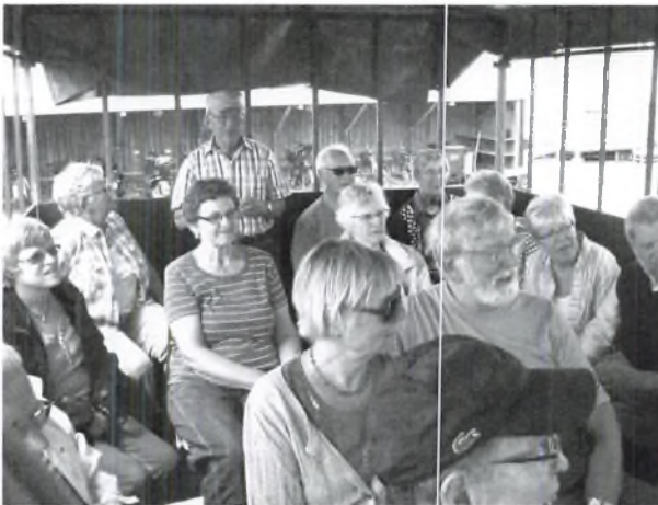
Rundtur I "Aarø- Bussen"

Turen blev ikke ringere af, at øen var tip-top i orden p.g.a. HM dronningens besøg i ugen efter!