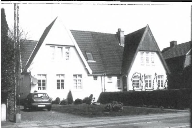
Eet af de kendte dobbelthuse på Hertug Hans Vej