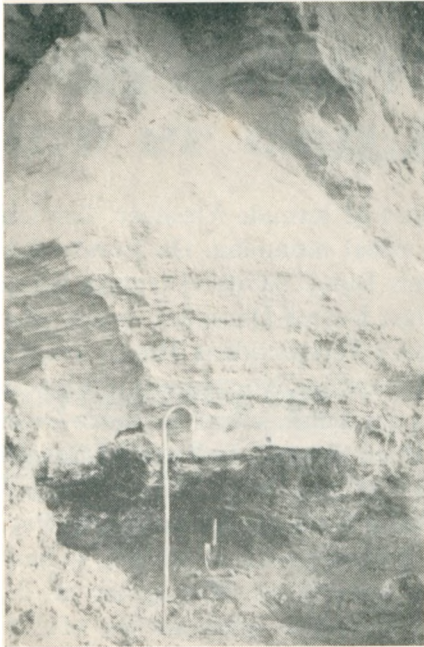
Den sydlige Mellemistidsmose i Emmerlev Klev. (Manser to Moser med mellemliggende Lerlag).