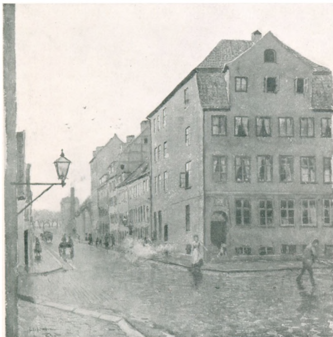
»Elefanten« taget efter en Akvarel; Nabohuset t. v. »Svanen«.

Han havde saaledes ingen Undervisning faaet, men ved Selvstudium paa de lange Rejser blev han en meget belæst