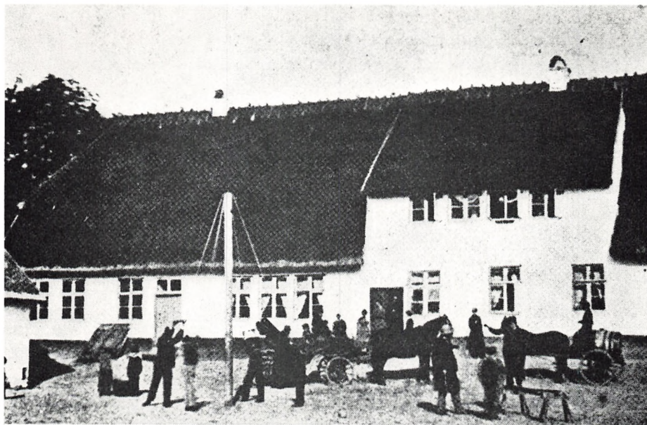
Birkerød præstegård, 1866.