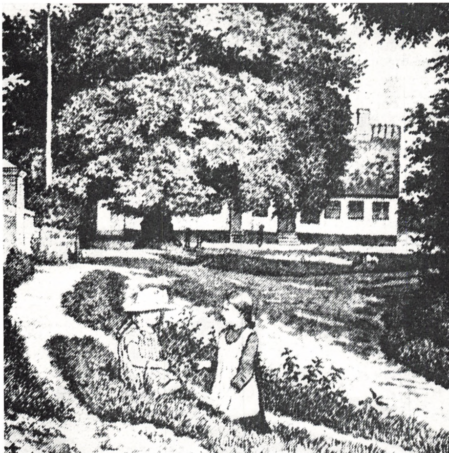
Majpladsen i Birkerød.

følelse, der blussede op i klare flammer hos vore forfædre – skulle vi være ringere end de? – Lad os ønske, at folket vil samle sig om Dannebrog, bryst mod bryst, mod fjenden, og lad os bede, at Danmark må leve med al sin rige herlighed. Foredraget ledsagedes af jævnlige bifaldsråb, og det af taleren udbragte leve for Danmark fulgtes af hurraråb.