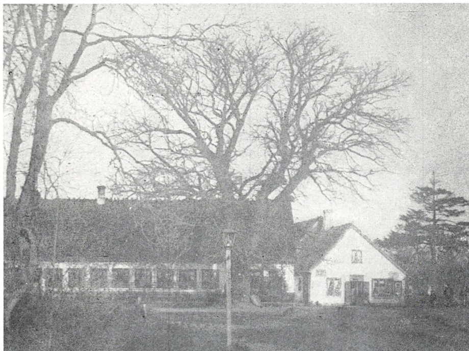
Birkerød gamle kro med købmandsbutik i gavlen omkring år 1900.