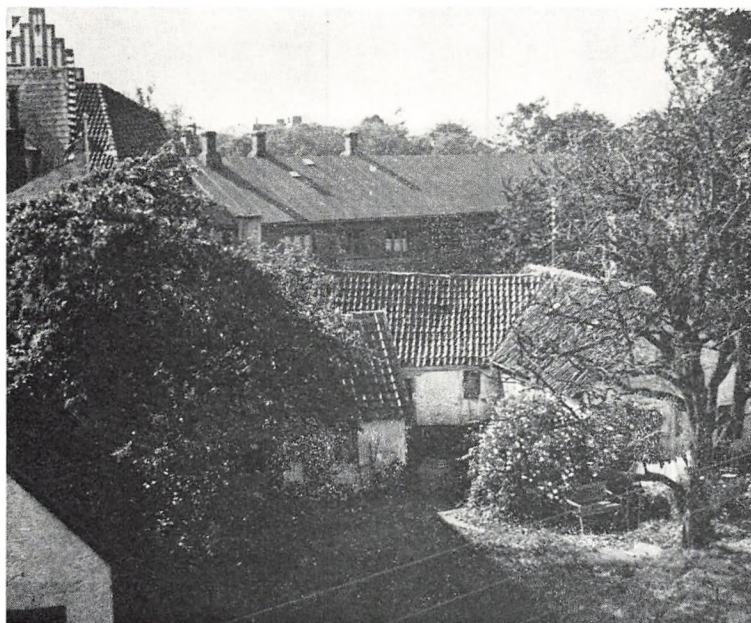
Birkerød gamle smedie.