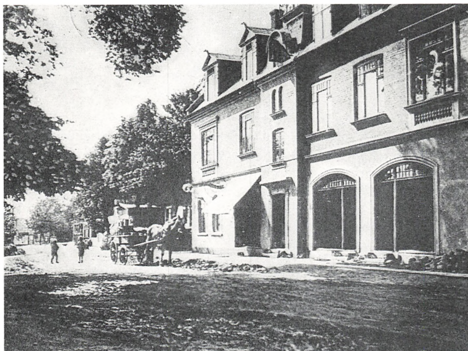
Birkerød hovedgade set fra Majpladsen.