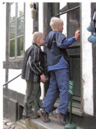
Et par af museets unge gæster er gået på opdagelse og er ved at undersøge, hvad der gemmer sig bag den lukkede dør.

Sommeren på Helsingør Theater stod i operaens tegn. Det mangeårige samarbejde med Aarhus Sommeropera mandede