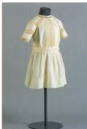
Pigekjole fra 1912. Den stammer fra en nedlagt manufakturforretning i Frederiksgade 6 i Århus og har aldrig været brugt.