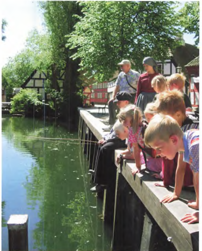
En sommerdag i Aagade.