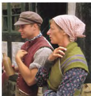
Den Gamle Bys omvandrede aktører, kaldet Truppen, er synlige i gadebilledet, hvor de kommer i tæt kontakt med publikum.