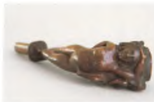
Pibe med erotisk sceneri udska- ret i bruyèrerod.