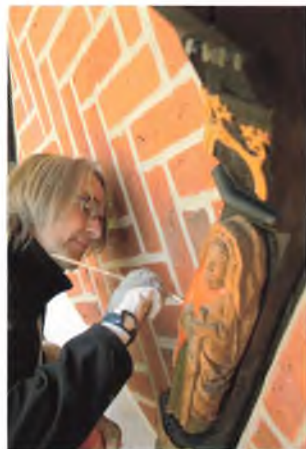
Sidste hånd lægges på bindingsværksmuren ved indgangen til Den Gamle By. Muren fortæller dansk bindingsværks historie i 500 år.

I 2008 har endvidere Toldboden, Højstolpehuset og Lemvighuset gennemgået en udvendig vedligeholdelse, hvor der er repareret tag, bindingsværk, murværk, skorstenspiber, døre og vinduer. Afslutningsvis er husene blevet nykalket, og døre og vinduer er malet.