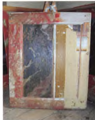
Et velbevaret panel blev afdækket i adskillige lag og aflørede den originale marmorering. I herrens kontor har malerne genskabt decorationen.

ger på paneler og karme på samme måde et udtryk for den datidige forestilling om marmor og en spejling af tiden, der krævede farver og kontraster.