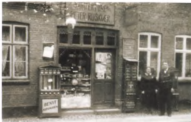
Cigarforretningen i 1930erne. Bag butiksruden var der cigar-æsker, piber, askebægre og cigarklippere. I forretningen, der havde et blandet udvalg, kunne man også købe slik og søde sager samt sytøj og broderi, og man kunne få rensset og presset sit tøj i baglokalet.