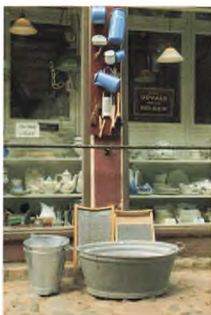
Boghandlen og isenkrammeren er allerede etablerede i Den Gamle Bys 1927 kvarter.

og tekstilpulje. Driften heraf støttes af Kulturarvsstyrelsen med 30.000 kr. Fra Farumgaard-Fonden har dragtpuljen modtaget 50.000 kr i støtte til en orddatabase over historiske dragt- og tekstiludtryk. Projektet har endvidere modtaget støtte på 20.000 kr fra Dronning Margrethes og Prins Henriks Fond og 5.000 kr fra Kong Frederik og Dronning Ingrid's Fond.