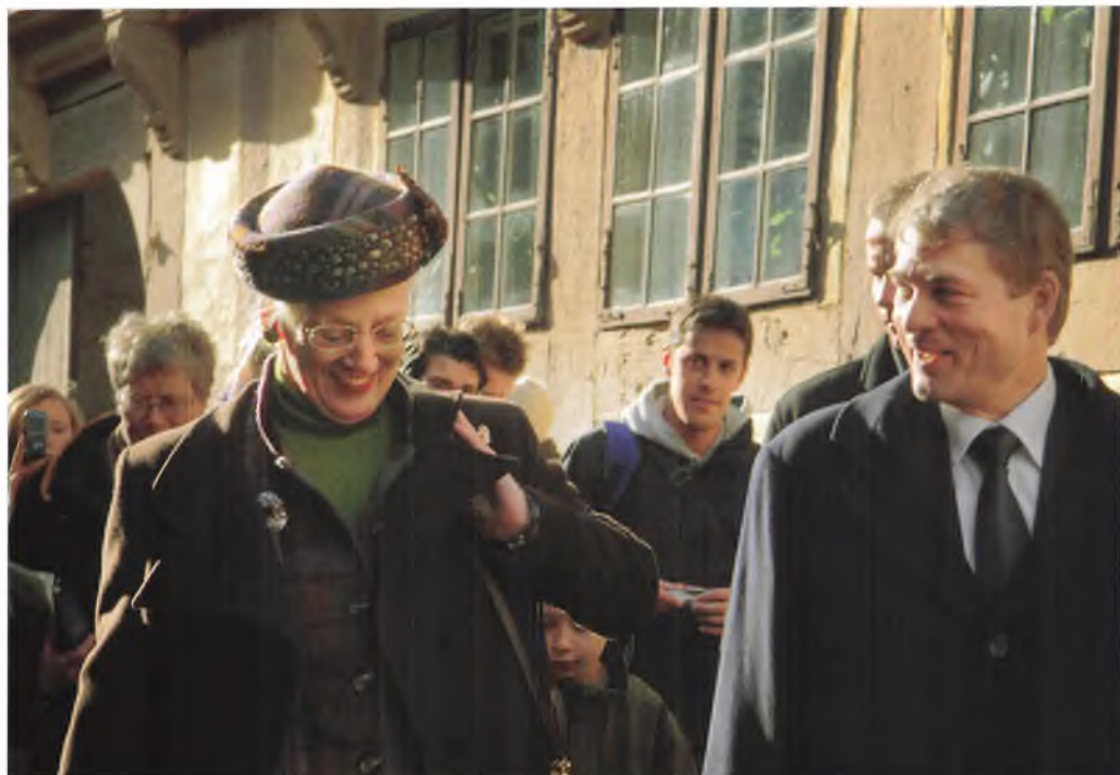
Hendes Majestæt Dronningen åbnede i påsken den perma- nente udstilling Musæum 1927 .

igen ud i en række sommerforestillinger. I 2008 gjaldt det Gaetano Donizettis Elskovsdrikken . Igen i år blev der både lavet almindelige forestillinger og specielle skoleforestillinger, hvor skolebørn kunne opleve en rigtig opera.