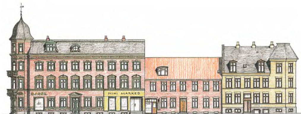
Facader i Den Moderne Bys Havnegade med, fra venstre, Helsingørhuset, Skottenborghu- set fra Viborg og hjørnehuset fra København.