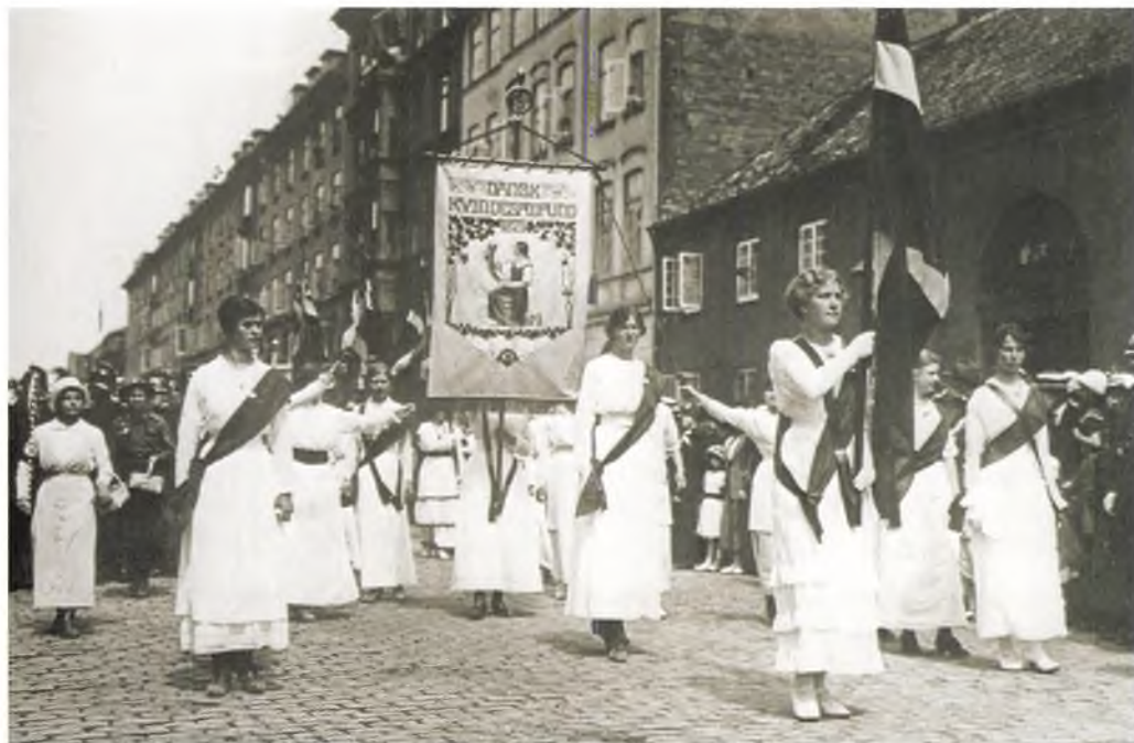
Kvindetoget 1915 med Dannebrog og Dansk Kvindesamfunds fane. Unge kvinder klædt i hvide festkjoler med kniplinger og flæser vandrer forrest. Efter Kvindeliv, Høst og Søn 1981.

perioden klædt i sit pæne tøj. 1970ernes opbrud med normerne om festlig påklædning viste sig naturligvis også ved de politiske fester. Mange mennesker tog afstand fra festtøj og mødte op til teaterpremierer og familiefester i hverdags-tøj. Til politiske demonstrationer blev dagligdags jeans, hønsestrikk og T-shirts med politiske budskaber almindeligt, eller man bar fantasifulde udklædninger til aktioner som for eksempel den politiske teatergruppe Solvognens happening, hvor julemandshæren eller grupper af indianere pludselig dukkede op.