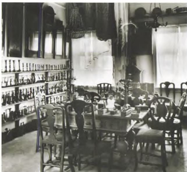
Billede taget efter en ombygning af Bornholms Museum i 1923. Det viser et rum på 1. sal med lige rækker af genstande på vægge, hylde og på bordet. Her ses gardiner i et udstillingsrum.

Formålet var både at forherlige købstadens navn og sikre området oldtidsminder. Derved skabtes interessen for vor fælles fortid og en ensartet nationalfølelse – eller dansk selvforståelse, om man vil.