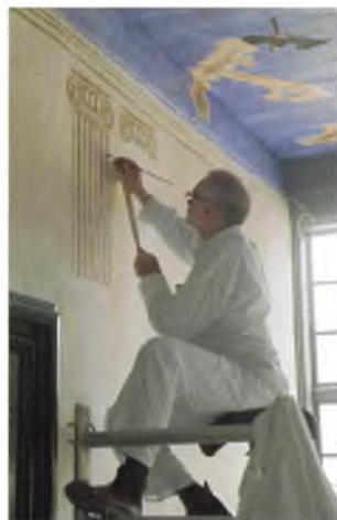
En række søjler giver Fugleloftssalen et præg af helhed. Både søjle- og landskabsmalerier har dekoreret Møntmestergårdens vægge i 1700'årene.