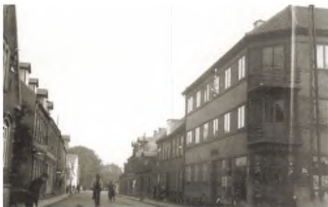
Skottenborg i 1950 som en travl og tæt gade. Nr. 9a anes til højre efter den høje ejendom i forgrunden.

Fordi man boede tæt, opstod der uundgåeligt et nært og