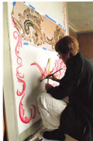
Femfagssalen får en dekoration af rocailler – en ornamentik med muslinger og sten. Maleren eksperimenterer sig frem til den helt rigtige version.

Det er en rocailledekoration fra den nu nedrevne herregård Rødset ved Ålborg, der er forlæggert for femfagssalens