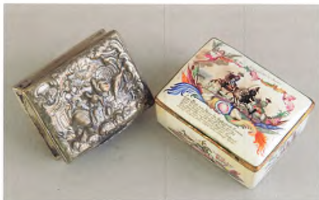
Snustobaksdåse i sølv med drevet motiv af Juno og påfuglen, ca. 1750 samt dåse i bemalet emalje fra midten af 1700tallet.

Snustobaksdåserne til opbevaring af snus er et helt kapitel for sig. Dåserne findes i snart sagt alle afskygninger og materialer fra de mest simple små æsker udskåret i træ, bark eller horn til de velhavende samfundslags overdådigt dekorerede dåser i guld og sølv med kunsthåndværksfulde ciseleringer og kost-