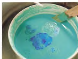
Den grønne farve til papirstapetet fremstilles over vandbad. Amoniak drypper langsomt i spanden med kobbersulfat og demineraliseret vand, og farven ændrer sig fra blå til grøn.