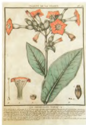
Tobaksplante gengivet i et fransk håndkoloreret kobberstik.

Planten fik sit officielle latinske navn "Nicotiana" i forbindelse med at en fransk ambassadør, der hed Jean Nicot, i 1561 ved hjælp af pulveriserede tobaksblade formåede at helbrede enkedronning Catharina af Medici for migræne. Bladene blev betragtet som et universalmiddel og fik en række positive tilnavne så som "den guddommelige urt" og "urten mod alt ondt".