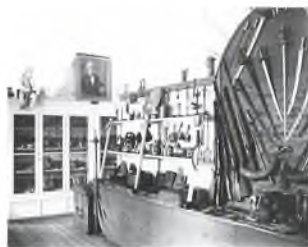
Billede fra Djursland Museum i perioden 1917 til 1924, hvor det lå på Lillegade 48 i Grenaa. Billedet har været en stor hjælp som kilde til ophængning af våben i Museum 1927.

Det ville være synd og skam radikalt at ændre husets sønderjyske interiør med diele, køkken med åbent ildsted, panelstue med alkove og bilæggerovn. På den anden side ville interiøret være yderst malplaceret i 1927kvarteret. Så Den Gamle By måtte finde på en anden løsning. Da provinsmuseer i begyndelsen af 1900tallet ofte lå netop i smukke, bevaringsværdige bygninger, fostrede vi på museet den idé, at man kunne bevare interiøret på den oprindelige plads ved at indrette et museum i bygningen. Samtidig ville Den Gamle By kunne fortælle historien om, hvordan provinsbyernes museer så ud på den tid.