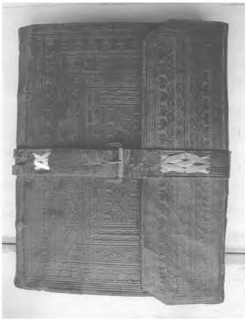
Forsiden af bindet til Helsingør skifteprotokol 1571-1582. Teksten er skrevet i hånden og lyder „Skiffte Bog“.