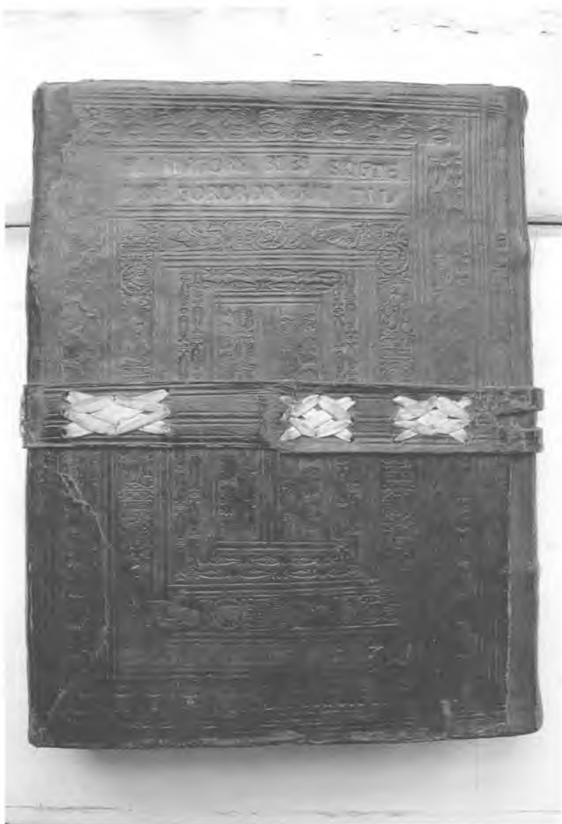
Bagsiden af bindet til Helsingør skifteprotokol 1571-1582. Teksten øverst lyder „HELSINGORS BIIES SKIFTE BOG FORORDINERIT TIL“ og nederst „SAMME BRVG 1571“.