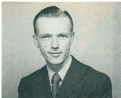
IV.E.1.b. Anker From Jensen