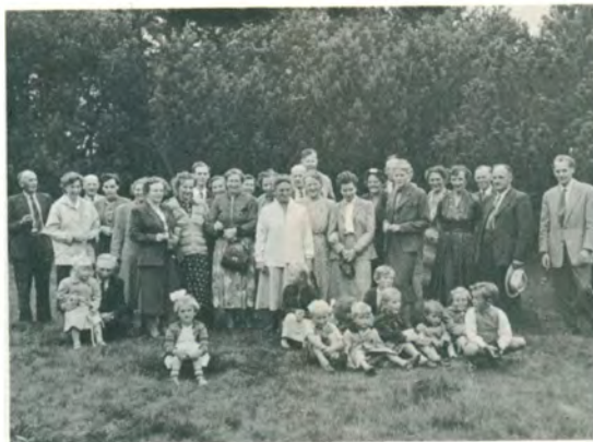
VIII.C. Udflugt med Lillethorup'er og venner