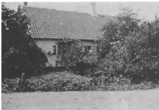
IV.E. "Familiehuset i Nykøbing F."