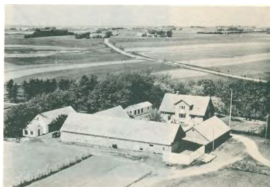
II.J.1. Chr. Laustsens gård "Lisentorp"