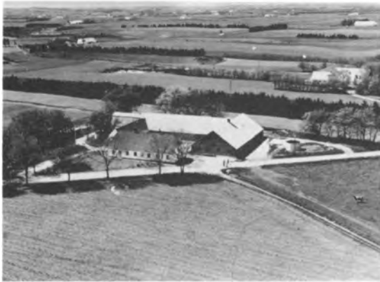
II.J.7. Svend Aage Sørensens gård "Alhøjgård"