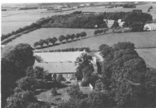
VIII.D. "Raadhøjgaard" i Ullits