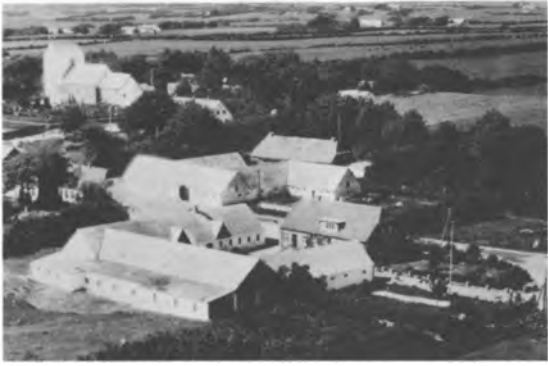
VIII.C.6. Fødegården i Vesterbølle (Johs. Lillethorup)