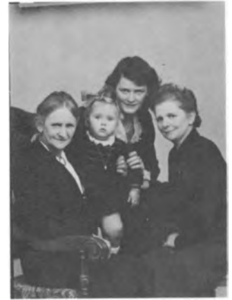
VII.C.1. VII.C.4. 4 generationer.