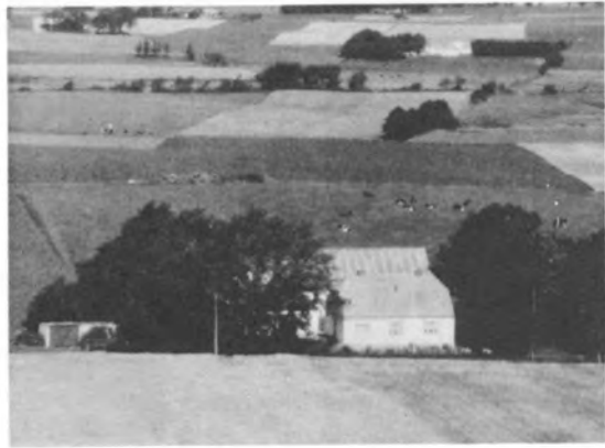
IV.C.3.e. "Ny Kalbækgaard"