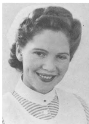
VIII.E.1. Asta Nielsen