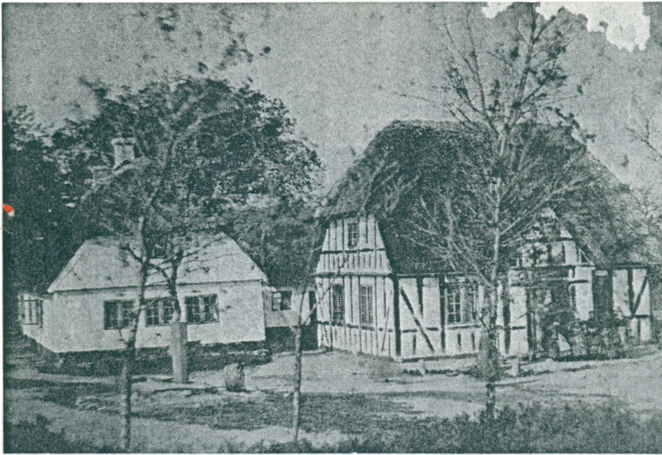
Tanderup gamle skole afløst af en nyere ca. 1900.