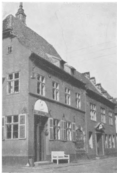
Apoteket i Helsingør.