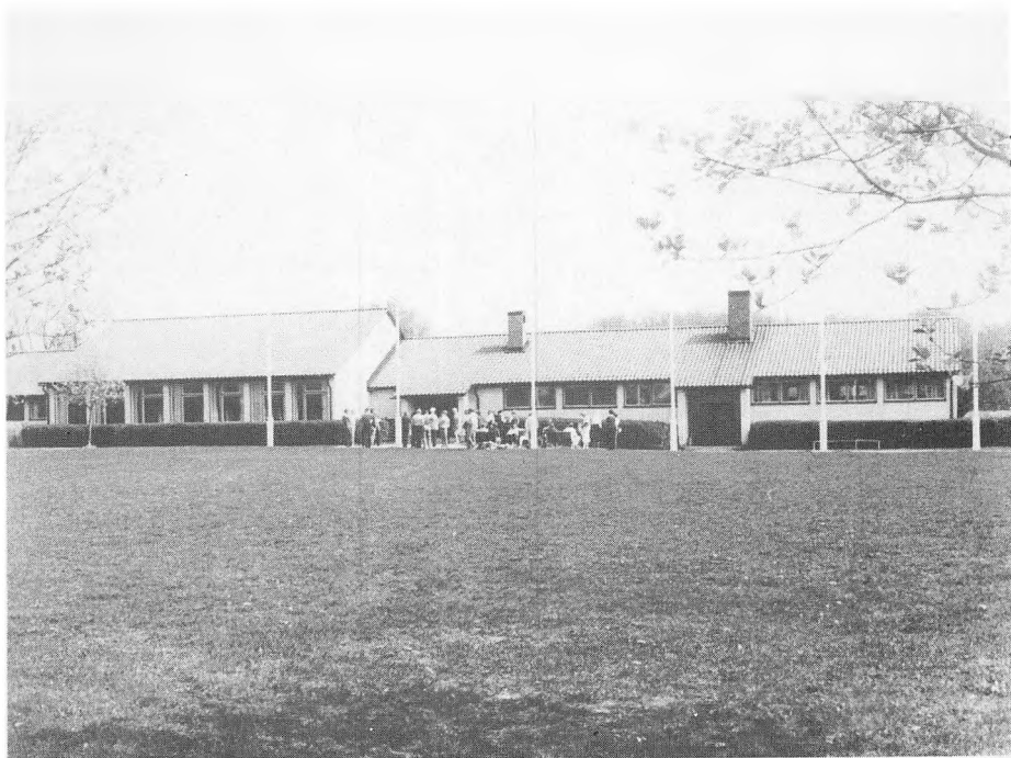
Nordens Folkhögskola, Biskops-Arnö, hvor konferencen fandt sted. Georg A. Gregersen fot. 1981.

Första dagen ägnades helt och hållet åt arkivstrukturen i de nordiska länderna med tyngdpunkt på folkrörelsearkiven och deras rikssammanslutningar. Den andra dagen ägnades åt arkivinventeringar och kursverksamhet. Insamling av bilder och muntligt källmaterial under punkten dokumentationsverksamhet samt förmedlingsaktiviteterna vid arkiven fick utgå. Den andra dagen upptogs också af en diskussion om möjligheter och former för ett fortsatt nordiskt samarbete. I försättningen ska göras ett försök att i mycket sammanträngd form sammanfatta de två dagarnas informations- och meningsutbytet. Det är ingen lätt uppgift att på ett begränsat utrymme koncentrera 10 timmars effektiv information och diskussion, (konferensen bandades), och referatet kan givetvis inte göra konferensen, de olika ländernas presentationer och den livliga diskussionen någon rättvisa.