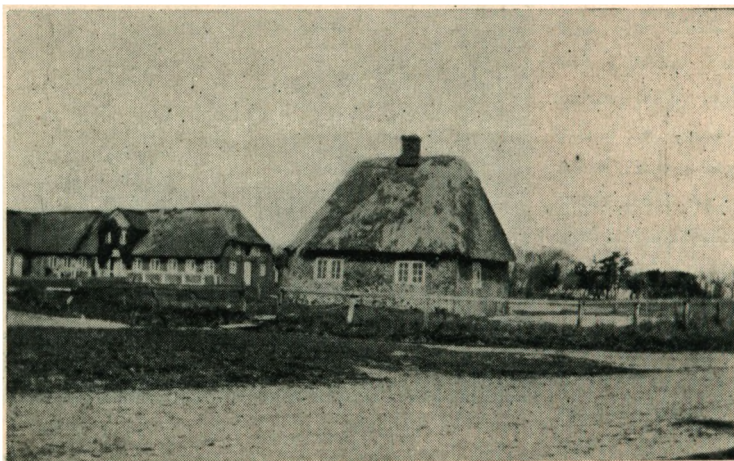
Den gamle Skole paa Rømø.

Imidlertid var allerede den Gang Begyndelsen gjort til det, der helt skulde forandre Livet paa Øen. Dampskibene tog Magten, og Ungdommen vendte sig i stigende Maal til andre Erhverv, men netop