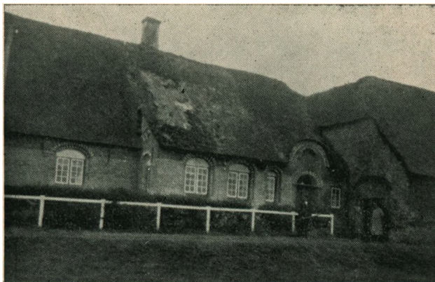
Chr. Petersens Gaard, Toftum. (Thade Petersens Hjem).

Skønt der saaledes var rigeligt med Søfolk paa Rømmø, er det vanskeligt at tale om særlige Sømandsslægter. De var jo Sø-mænd saa godt som alle, og der fandtes endnu for 50—60 Aar siden næppe en Familie derovre, der ikke havde et eller flere Medlemmer til Søs og havde haft det gennem saa mange Led, at de med fuld Ret kunde kaldes Sømandsslægter. At være Sømandsslægt var