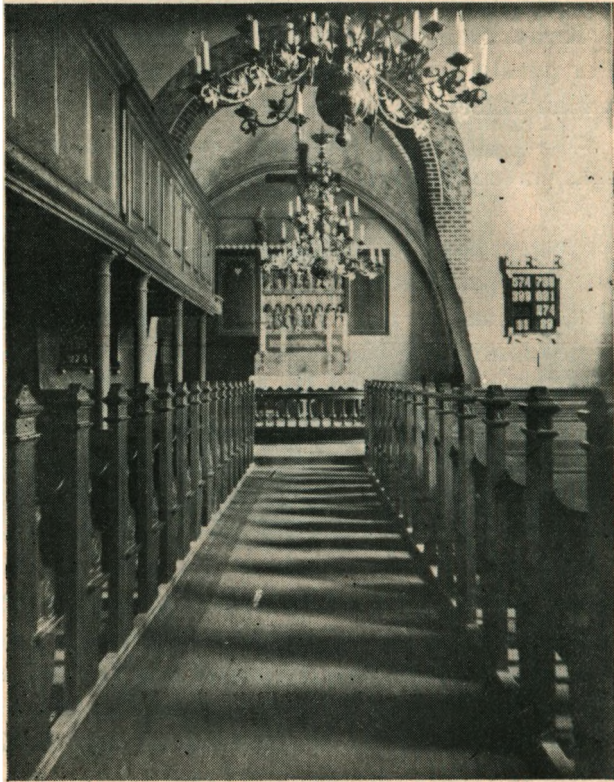
Felsted Kirkes Indre.

I Kirkens Indre er der i Tidens Løb foregaaet en Del Forandringer. Skibet har beholdt sit Bjælkeloft, mens Koret har faaet ind-